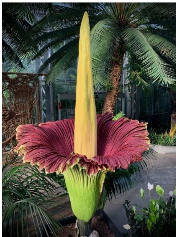
Slika 2. Cvijet vrste Amorphophallus titanum

( https://www.usbg.gov/gardens-plants/corpse-flowers , 9.9.2024.)