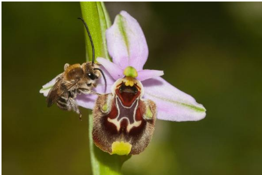
Slika 4. Pčelinja kokica ( Ophrys apifera ) koja mimikrijom privlači mužjake pčela Eucera spp.

Wong i Schiestl (2002) utvrdili su da orhideje koriste različite metode kako bi primamili oprašivače i ne oslanjaju se samo na proizvodnju nektara. Ugrožena vrsta u Hrvatskoj, pčelinja kokica ( Ophrys apifera ) (Slika 4.), jedan je od najpoznatijih primjera mimetizma - fizičkog oponašanja drugog organizma. Labelum, medna usna ove orhideje podsjeća na ženku pčele Eucera spp. s kojom se mužjak pokušava pariti, a ponekad zalazi dublje u cvijet u potrazi za još ženki. Tada se polen zalijepi za dorzalnu stranu mužjaka pčele. Nakon što napusti cvijet, kada mužjak pčele ponovno uoči cvijet Ophrys apifera , opet će se pokušati pariti i prenijet će polen na njušku tučka sadržanoj u strukturi ginestomija. Taj proces, gdje se kukci pokušaju pariti s cvijetom nekih vrsta orhideja, naziva se pseudokopulacija.