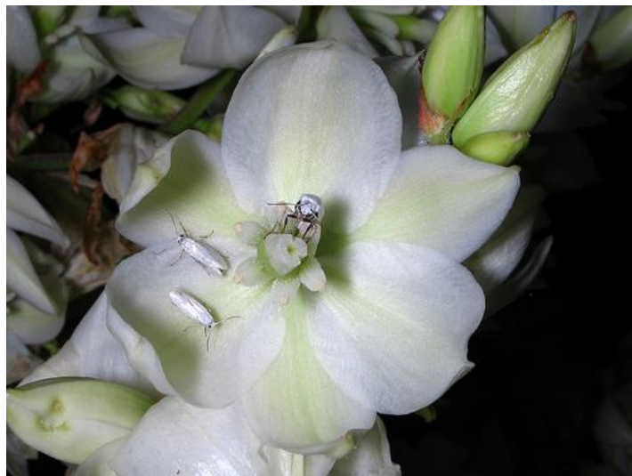
Slika 7. Cvijet vrste unutar roda Yucca oprašivan moljcima iz porodice Prodoxidae