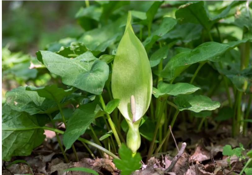
Slika 3. Arum maculatum . ( https://www.britannica.com/plant/cuckoopint , 9.9.2024.)