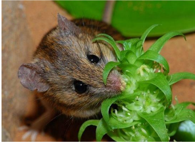
Slika 8. Cvjetovi Whitehedia bifolia oprašivani mišem Aethomys namaquensis ( https://blog.umd.edu/agronomynews/2021/05/ , 9.9.2024.)