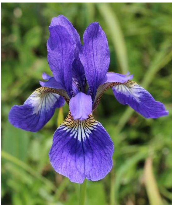
Slika 6. Cvijet perunike ( Iris sp.)