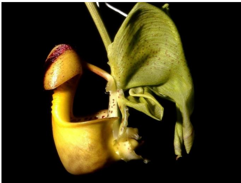
Slika 5. Orhideja iz roda Coryanthes s labelumom preobraženim u vrč ( https://en.wikipedia.org/wiki/Coryanthes_macrantha , 9.9.2024.)