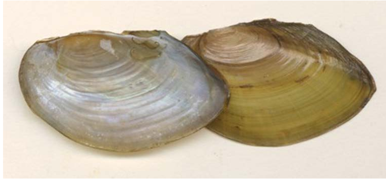
Slika 5. Pseudanodonta complanata