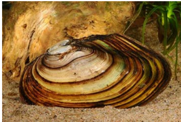
Slika 4. Anodonta anatina