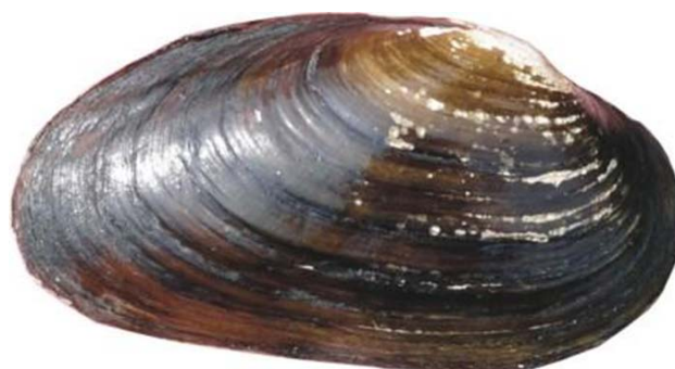
Slika 6. Unio crassus

Školjkaš Unio crassus (Slika 6) je tamne, gotovo crne boje, četvrtastog do ovalnog oblika. Ljuštura je u prosjeku duga do 7 cm (Pfleger, 1999). Kod vrste U. pictorum (Slika 7) ljuštura je izdužena pri čemu je dužina dvostruko veća od visine. Mogu doseći dužinu do 14 cm. U. tumidus (Slika 8) je također ovalnog oblika, duljina mu je gotovo dvostruko veća od visine sa širim prednjim krajem. Boja je zeleno – žuta sa zelenkastim zrakama. Karakteristična duljina ljušture je između 6.5 i 8 cm (Killeen i sur., 2004). Ljuštura školjkaša U. mancus (Slika 9) je žute ili tamno smeđe boje te je ovalnog oblika. Žive na pješčanim dnima i dobar su pokazatelj kakvoće vode. Nalaze se jedino u čistim vodama ( http://www.animalbase.uni-goettingen.de/zooweb/servlet/AnimalBase/home/species?id=2120 ).