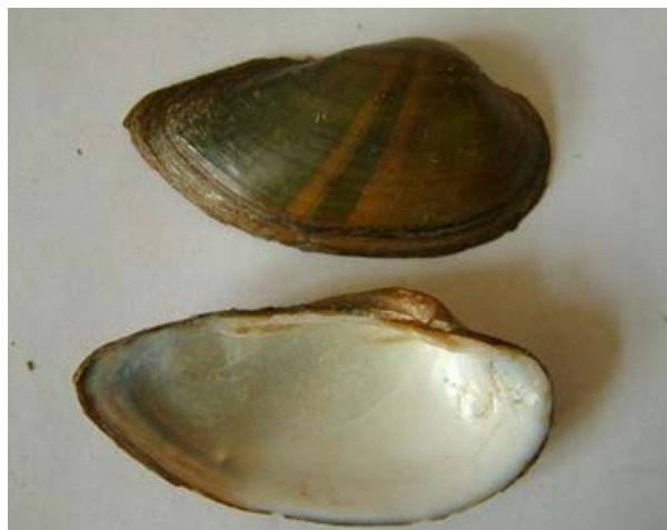
Slika 8. Unio tumidus