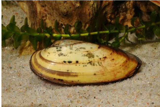
Slika 7. Unio pictorum