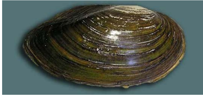
Slika 3. Anodonta cygnea