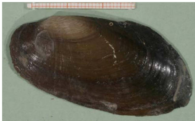
Slika 10. Microcondylaea bonellii

Vrsta Myrocondylaea bonellii dolazi u potocima, rijekama i jezerima s umjerenim strujanjem vode. Rasprostranjena je duž južne i jugoistočne Europe (Slika 10). Ljuske su tanke, zeleno – smeđe boje, a prosječna duljina je oko 8 cm (Pfleger, 1999).