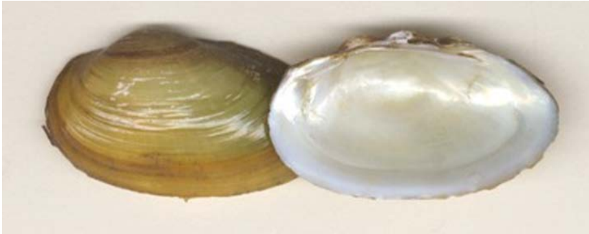
Slika 9. Unio mancus