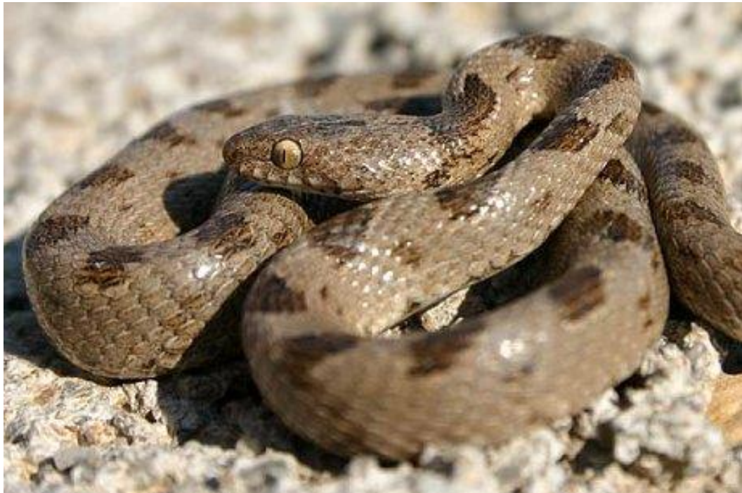
Slika 7. Crnokrpica ( Telescopus fallax )

Zmija vitkog tijela, blago bočno spljoštena, naročito u prednjem dijelu. Može doseći duljinu od 80 cm, rijetko i preko 100 cm. Sivkasta ili smečkasta leđa i bokovi ravnomjerno su isprekidani većim tamnim mrljama koje su naizmjenično raspoređene, dok je trbušni dio svjetliji. Mladi imaju istu obojenost kao i odrasle jedinke. Crnokrpica (sl. 7) ima spljoštenu i izraženu jajoliku glavu te okomite zjenice, iako ne pripada otrovnicama (porodica Viperidae ), već tzv. poluotrovnicama. Njih još nazivamo i stražnježljebozubicama ili opistoglifnim zmijama – otrovni zubi s utorom smješteni su u stražnjem dijelu gornje čeljusti i otrov ulazi u žrtvu žvakanjem. Kod crnokrpica otrov je bezopasan za ljude i služi za svladavanje plijena. (Boulenger 1913; Kreiner 2007).