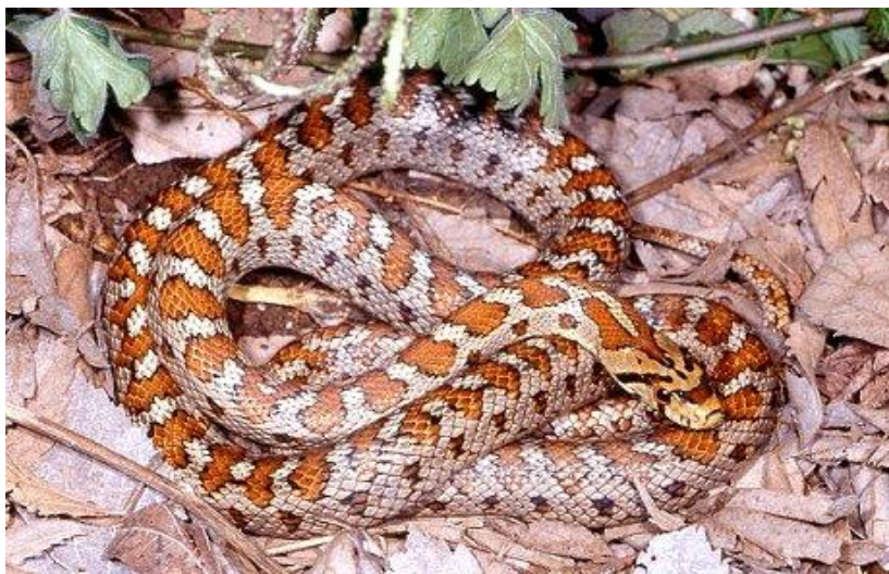
Slika 6. Crvenkrpica ( Zamenis situla )

Crvenkrpica (sl. 6.) je zmija vitkog tijela i uske glave, prosječna duljina tijela je od 60–100 cm. Temeljna boja je siva ili crvenkastosiva (može biti i žućkastosiva te zelenkastosiva) s velikim crvenosmeđim pjegama (pjegavi morfološki tip) ili prugama (prugasti morfološki tip) koje imaju crni obrub. Naizmjenično s leđnim mrljama s obje strane tijela, niže se niz manjih crnih, većinom poprečnih, mrlja. Na glavi s gornje strane gotovo uvijek postoje crne ili smeđe poprečne trake, a na zatiljku je tamna zatiljna mrlja iza koje počinje niz tamnocrvenih ili smeđih mrlja. Kod prugastih se oblika leđne mrlje niz hrbat postupno stapaju u dvije pruge koje se protežu do vrha repa. Oba morfološka tipa možemo naći u mnogim populacijama u različitim omjerima, iako je prugasta forma obično dosta rjeđa. Mlade jedinke imaju obojenost kao i odrasle jedinke (Jelić i sur. 2012b).