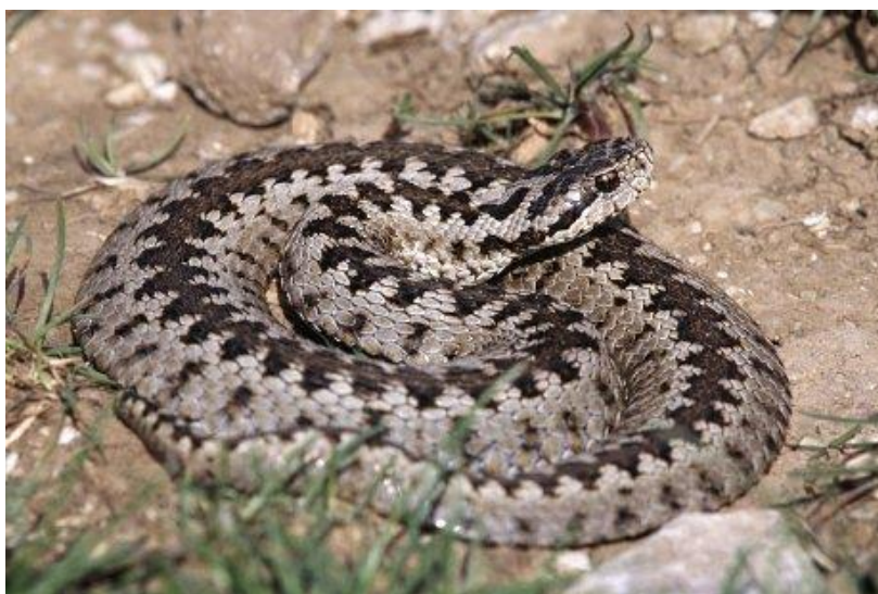
Slika 8. Planinski žutokrug ( Vipera ursinii macrops )

lokaliteti starijih autora na otoku Krku nisu potvrđeni novijim istraživanjima (Jelić i sur. 2012a). Nalaz s područja Vrljike kojeg spominje Kolombatović (1900) se najvjerojatnije odnosi na primjerak planinskog žutokruga (sl. 8) koji se i danas čuva u Prirodoslovnoj zbirci Narodnog muzeja u Zadru, a prikupio ga je Katurić 15.03.1899. na Dinari. Globalni trend je u opadanju zbog izrazito malih i fragmentiranih populacija te ubrzanog nestanka povoljnih travnjačkih staništa. U Hrvatskoj su populacije u blagom opadanju, primarno zbog smanjenja povoljnih staništa (Jelić i sur. 2012b).