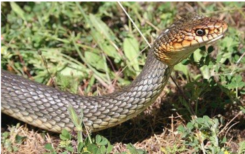
Slika 3. Žuta poljarica ( Dolichophis caspius )

Žuta poljarica (sl. 3) u našim krajevima dolazi do sjeverozapadne granice svoje rasprostranjenosti i stoga je tu vrlo rijetka vrsta. Pojavljuje se samo u izoliranim populacijama u centralnom dijelu Mađarske i istočnom dijelu Hrvatske uz Dunav. U istočnoj Hrvatskoj dolazi samo na području Baranje (Bansko brdo; Batina) i potencijalno u malim izoliranim populacijama uz Dunav, sve do Fruške gore. U južnoj Hrvatskoj vrlo je česta na otoku Lastovu i pojedinim okolnim otocima (Mrčara, Kopište), a odnedavno je zabilježena i na otoku Olibu (Kletečki i sur. 2009). Opravdano je sumnjati da se, posebice u slučaju Oliba, radi o introduciranim populacijama. Na otok Lastovo vrsta se možda i prirodno naselila jer snažne morske struje donose na otok velike količine materijala s crnogorsko-albanske obale (posebice s ušća Bojane). U istočnoj Hrvatskoj, kao i u Mađarskoj i Srbiji, uočen je negativni trend, najčešće kao posljedica drastičnog nestanka staništa (Jelić i sur. 2012b).