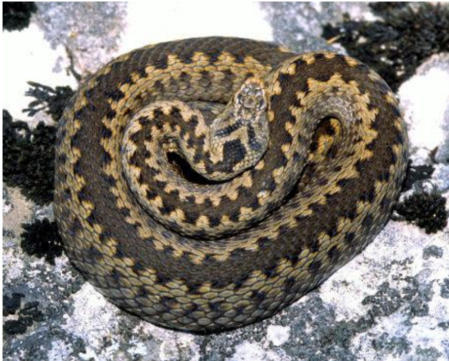
Slika 9. Riđovka ( Vipera berus )

U Hrvatskoj dolazi pretežno u kontinentalnim krajevima (dolina Save, Drave i Dunava), Gorskom kotaru te na pojedinim dijelovima lanca Dinare (masiv Troglava) na granici s Bosnom i Hercegovinom (Jelić i sur. 2009, 2012a). U Hrvatskoj je riđovka (sl. 9) zastupljena s dvije podvrste, V. b. berus koja naseljava samo brdska i planinska područja Gorskog kotara te V. b. bosniensis koja naseljava ostatak areala (kontinentalne nizine Save, Drave i Dunava te visokoplaninska staništa na Troglavu) (Ursenbacher i sur. 2006; Jelić i sur. 2009). Populacije iz Gorskog kotara u Hrvatskoj te populacije u sjevernoj Italiji i Sloveniji čak se smatraju i odvojenom "talijanskom filogenetskom linijom" od nominalne podvrste V. b. berus (Ursenbacher i sur. 2006). Ova linija još nije opisana kao zasebna podvrsta. U Hrvatskoj su brdske i planinske populacije u Gorskom kotaru i na Troglavu stabilne, dok su nizinske populacije u značajnom padu primarno zbog nestanka staništa (Jelić i sur. 2009).