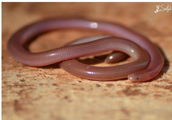
Slika 2. Sljeparica ( Typhlops vermicularis )

U Hrvatskoj postoji podatak o nalazu samo jedne jedinke sljeparice (sl. 2) na Dugom otoku u Parku prirode Telašćica. Jedinku je prikupio dr. Peter Weish tijekom ranog jutra ispod stijene oko 300 m jugozapadno od mjesta Sali u srpnju 1977. godine (Grillitsch i sur. 1999). Unatoč relativno čestim pretraživanjima lokaliteta od strane hrvatskih i inozemnih istraživača, do danas nije zabilježen ni jedan novi nalaz (Jelić 2013). Potrebno je provesti detaljna istraživanja kako bi se utvrdilo je li vrsta stvarno prisutna na tom području (Jelić i sur. 2012b).