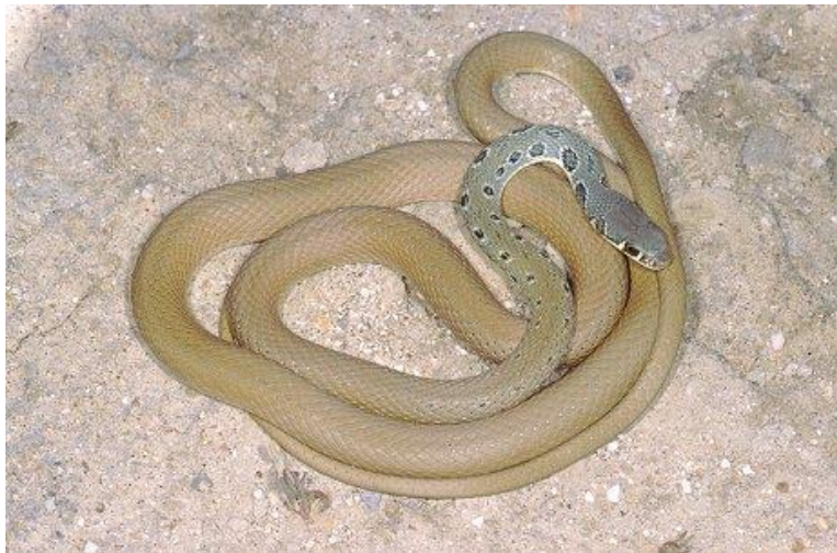
Slika 4. Šilac ( Platyceps najadum )

Sjeverni dio areala ove vrste započinje na kvarnerskim otocima Krku i Pagu, nakon čega se preko obalnog dijela Dalmacije spušta prema Bosni i Hercegovini, do južnih dijelova Srbije, Crne Gore, Makedonije, centralne Bugarske, Albanije, Grčke, Turske pa sve do Turkmenistana. U Hrvatskoj je šilac (sl. 4) rasprostranjen isključivo u priobalnom, mediteranskom dijelu, uključujući i mediteranske planine poput Biokova (Jelić i sur. 2012b).