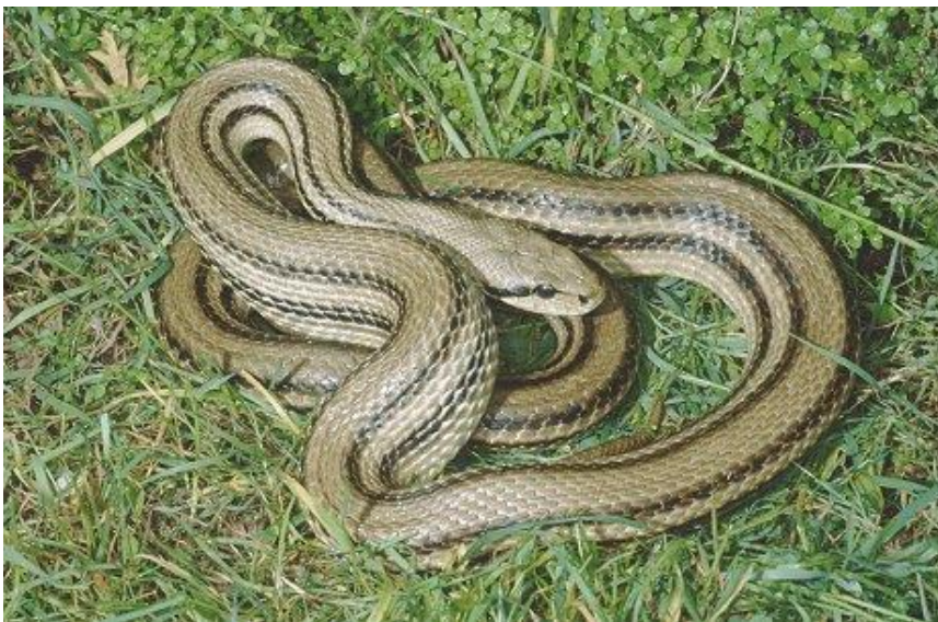
Slika 5. Četveroprugi kravosas ( Elaphe quatuorlineata )

Kravosas (sl. 5) je najduža europska zmija koja može narasti i preko 200 cm (poznati su primjerci i do 240 cm), ali u prosjeku su dugačke oko 150–160 cm. Temeljna boja s gornje strane je smečkasta, s po dvije tamne pruge na leđima sa svake strane tijela (ukupno četiri), po čemu je i dobio naziv. Trbušna strana je svijetla i samo u nekih jedinki posuta tamnim pjegama. Robusnog je i mišićavog izgleda, glava je dobro izražena, a iza očiju ima tamnu prugu. Spolni dimorfizam je vrlo slabo izražen. Mladi imaju drugačiji uzorak šara pa na svijetlosivoj do smečkastoj podlozi imaju tamne mrlje (na leđima i bokovima) te se na prvi pogled mogu zamijeniti s crnokrpicom ( Telescopus fallax ). Promjene u obojenosti započinju oko jedne godine starosti tj. pri 50–60 cm duljine. Tijekom rasta ispoljavaju karakteristike oba izgleda, a s 3–4 godine (oko 120 cm dužine) u potpunosti završe s promjenom obojenosti te nastupa spolna zrelost (Böhme i Ščerbak 1993; Schulz 1996).