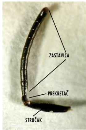
Slika 3. Građa ticala

( http://www.blog.dnevnik.hr/apikultura/osjetni_sustav.html )