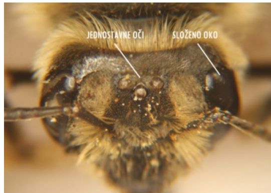
Slika 2. Optička osjetila pčele – izgled i položaj jednostavnih i složenih očiju.

ultraljubičastu, modru i modrozelenu, dok crvenu ne vide tj. vide je kao tamnosivu do crnu. Za pčele je važno da vide ultraljubičasti dio spektra jer gotovo jedna četvrtina cvjetova reflektira ultraljubičaste zrake (detaljnije u poglavlju 5. Orijentacija pčela). Također, dobro razlikuju oblike pojedinih predmeta i pojedinih cvjetova.