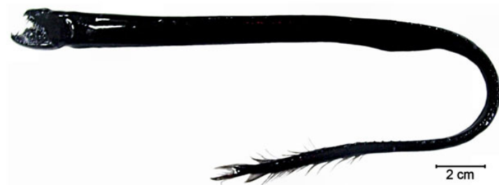
Slika 4. Crni zmijozub ( Idiacanthus antrostomus )

Pripada porodici Stomiidae. Ima crno, zmijoliko tijelo i velike zube koji se moraju okretati kako bi se usta mogla otvoriti i zatvoriti. (Slika 4.) Ženke su 4 puta dulje od mužjaka. Plijen privlači koristeći svjetleći organ koji je smješten na kraju brčića, koji se pruža iza prednjeg dijela donje čeljusti. Ima svjetleće organe duž trbuha. Hrani se noću pomičući se bliže površini i lovi manje ribe. (Borovac, 2001.)