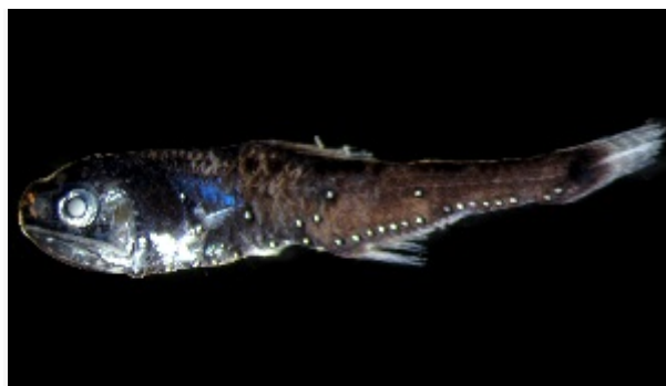
Slika 7. Žaboglav trnasti ( Myctophum asperum )

Pripada redu Myctophiformes. (Slika 7.) Jedna je od najbrojnih dubokomorskih vrsta riba i važna spona u oceanskom hranidbenom lancu. Jedu planktonske račiće, a njih jedu tuljani i veće ribe. Imaju svjetleće organe na glavi i tijelu. Različit raspored ili veći svjetleći organi blizu repa pokazuju je li riba mužjak ili ženka. (Borovac, 2001.)