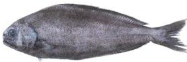
Slika 8. Pastir šiljoglavac ( Centrolophus niger )

Pripada redu Perciformes. ( Slika 8. ) Živi pojedinačno ili u manjim jatima. Tijelo je vretenastog oblika, bočno spljošteno. Boja tijela je crna s leđne strane, siva s trbušne strane tijela. Naraste do 150 centimetara. Iako je dubokomorska vrsta, zalazi i u pliće vode. Mlade jedinke imaju poprečne tamne pruge na bokovima i žive blizu površine. Mrijeste se tijekom jeseni i zime. Hrane se mekušcima, ribama, meduzama. Kozmopolit, u Jadranu je veoma rijedak, najbrojniji je u istočnom Atlantiku i južnom Pacifiku. (Borovac, 2001.)