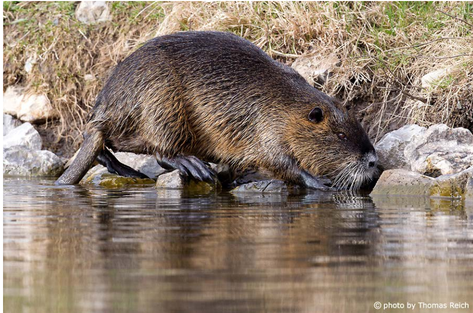
Slika 1. Myocastor coypus (nutrija )

Invazivne vrste danas su jedna od najvećih prijetnji bioraznolikosti. Nutrija ( Myocastor coypus ) spada u 100 najinvazivnijih vrsta u svijetu. Nutrija (Sl. 1) je veliki semiakvatički glodavac koji se uglavnom hrani vodenom vegetacijom, a time ugrožava brojne druge vrste. Podrijetlom je iz Južne Amerike, a u ostatak svijeta unesena je za potrebe proizvodnje krzna na farmama početkom 20. stoljeća. Ubrzo počinje naseljavati divljinu gdje osniva samoodržive populacije. Jedina dva kontinenta nenaseljena nutrijom su Australija i Antarktika. Štete koje nutrija izaziva su brojne, osim utjecaja na ekosustave i autohtone vrste, nutrija utječe i na obale rijeka, nasipe, poljoprivredu i sustave navodnjavanja te uzrokuje brojne materijalne štete. Mjere koje se poduzimaju podrazumijevaju mjere kontrole populacije i mjere eradikacije kojima se broj jedinki na nekom prostoru svodi na nulu. Nekolicina zemalja pokušala je iskorijeniti nutriju provodeći ovakve mjere. U Ujedinjenom Kraljevstvu 80-tih godina prošlog stoljeća provedene su mjere eradikacije, dok se u Italiji provode mjere kontrole populacije.