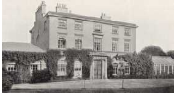
Slika 2. Darwinova kuća u Shrewsburyu ( www.darwin-online.org.uk )