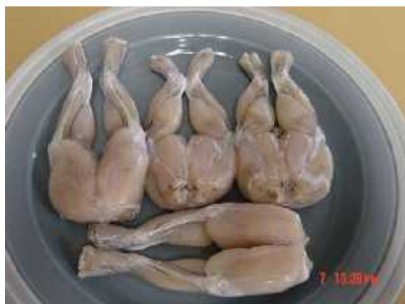
Sl. 10. Žabljaci kao izvor hrane i delicija u restoranima diljem svijeta

Diljem svijeta vodozemci se sakupljaju i uzgajaju za iskorištavanje. Vodozemci se upotrebljavaju u prehrani, kao ljubimci, u medicini, obrazovanju i istraživanjima te kao mamci za ribe. Glavni izvor hrane među vodozemcima su žabljaci. (Sl. 10.)