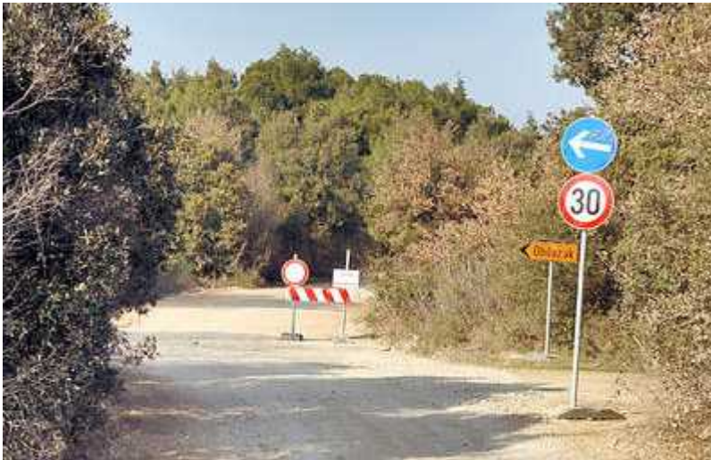
Sl. 9. Gradnja prometnica jedan je od načina ugrožavanja staništa vodozemaca

Promjena staništa je takav utjecaj na stanište koji utječe na funkciju ekosistema, čak i ako to nije potpuno ili trajno. Primjer je ispaša stoke. Stoka može izgaziti vodenu vegetaciju i izazvati ubrzanu eroziju obale bare čime stanište postaje nepovoljno za vodozemce. Rješenje za ovaj problem bilo bi ograničavanje dijela bare kako bi se stoci onemogućio pristup, što za posljedicu ima nesmetan rast vegetacije na ograničenom dijelu.