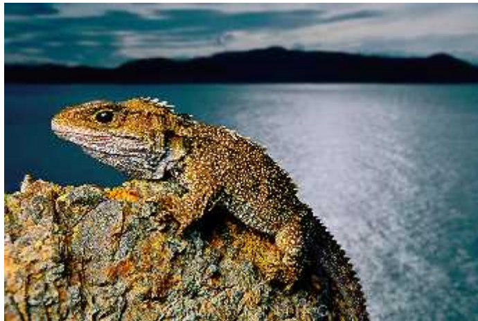
Slika 5. Brothers tuatara ( http://cdn.c.photoshelter.com/img-get/I0000UxzR7h3pPck/s/750/008316-01.jpg )

U zadnjih par godina znanstvenici izdvajaju još jednu vrstu tuatara, latinskog imena Sphenodon punctatus punctatus . Obitava na udaljenim sjevernim otocima, pa se zove i 'Northern tuatara', a sve joj se više pridodaje pažnje u istraživanjima i konzervacijskim akcijama.