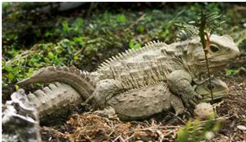
Slika 4. Parenje – rijedak događaj

Izvišteno se da zaključiti da se vrlo malo energije ulaže u razmnožavanje i podizanje mladih. Zato se ona usmjerava na metabolizam, koji je spor, ali koji uzrokuje neobično dugi životni vijek jedinki. Spolna zrelost se dostiže tek sa 15 godina, a krajnja veličina sa 25 do 35 godina. Iako je taj podatak još uvijek misteriozan, tuatara u prosjeku žive 61-71 godinu, a pretpostavlja se da mogu živjeti i više od 100 godina (MacAvoy, 2007.).