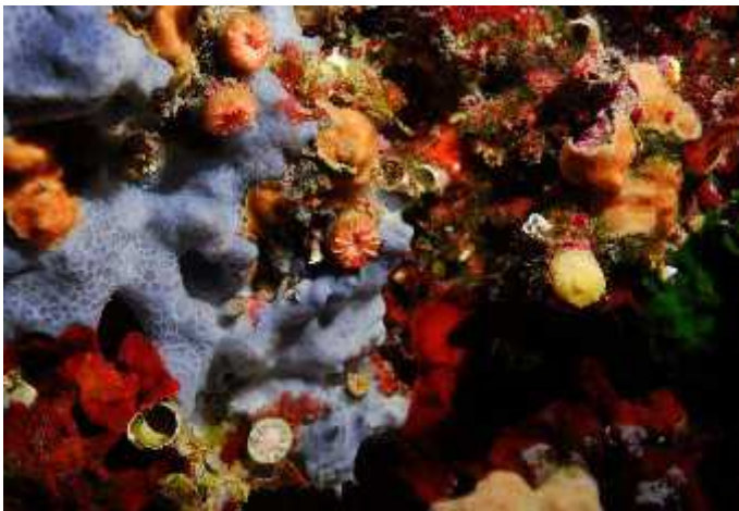
Slika 9. Nekroza tkiva kod kamenih koralja Leptopsammia pruvoti i Caryophyllia inornata