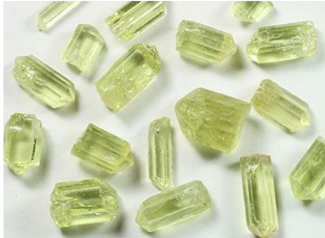
Slika 5. Zeleni kristali apatita veličine prosječno 8 mm.