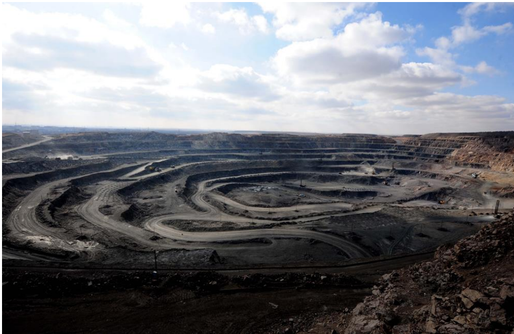
Slika 6. Bayan Obo površinski iskop u Kini.

Najveće koncentracije REE u Kini se nalaze na ležištu Bayan Obo (slika 6). Za ovo ležište pretpostavlja se da je najveće ležište REE u svijetu. Formiralo se sredinom proterozoika kao posljedica riftinga. Ovo ležište je stratabound tipa u kojemu je stijena domaćin dolomit. Proteže se 18km u duljinu i dijeli se na tri rudna tijela – glavno rudno tijelo, istočno i zapadno. Otkriveno je oko 170 mineralnih vrsta, a ekonomski najvažniji su bastnašit i monacit za eksploataciju elemenata rijetkih zemalja (prvenstveno LREE), i željezoviti minerali (hematit i magnetit) za eksploataciju željeza (Walters i sur., 2015).