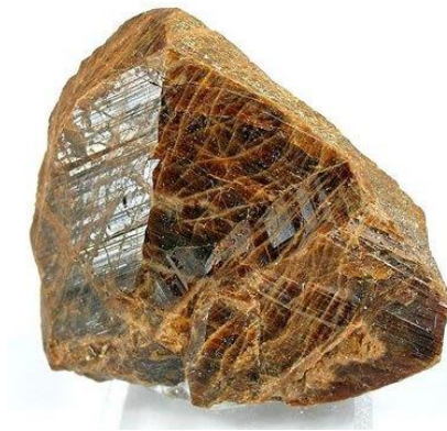
Slika 3. Kristal monacita veličine oko 5 cm.

Monacit je mineral koji kristalizira u monoklinskom kristalnom sustavu, žućkasto, crvenkasto i zelenkasto smeđe boje, dijamantnog do voštanog sjaja (Slika 3). Spada u nesilikate, razred fosfata, u fosfate tipa A(XO 4 ), u grupu monacita (Bermanec, 1999.). Najrašireniji je mineral elemenata rijetkih zemalja. Tvrdoće je 5 – 5 ½ i dosta otporan na trošenje pa ga se zbog toga vrlo često može naći u nanosima rijeka i u pijescima koji su nastali mehaničkim trošenjem granitskih i sijenitskih pegmatita i gnajseva. Najčešće je izvor lakih elemenata rijetkih zemalja (LREE) i važno je naglasiti da u svom sastavu ima i torij (Th) (Walters i sur., 2015). Ovisno o tome koji REE je najzastupljeniji u sastavu, kemijska formula monacita se mijenja: (Ce,La,Nd,Th)PO 4 ako je dominantan cerij (monacit-(Ce)), (La,Ce,Nd)PO 4 ako je dominantan lantan (monacit-(La)) i (Nd,La,Ce)PO 4 ako je dominantan neodimij (monacit-(Nd)). Najveću ekonomsku važnost ima monacit-(Ce).