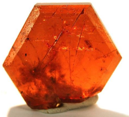
Slika 2. Kristal bastnäsit veličine oko 1,5 cm.

Bastnäsit je mineral koji kristalizira u heksagonskom kristalnom sustavu, voštanožute do crvenkastosmeđe boje, staklastog do masnog sjaja i tvrdoće 4 – 4 ½ (slika 2). Ime je dobio prema tipskom lokalitetu u Švedskoj, rudniku Bastnäs. Spada u nesilikate, razred karbonata, u karbonate s dodatnim anionima (Bermanec, 1999). U kemijskom sastavu mogu dominirati cerij, lantan ili itrij, pa se prema tome razlikuju bastnäsit-(Ce) ((\text{Ce,La})(\text{CO}_3)\text{F}) , bastnäsit-(La) ((\text{La,Ce})(\text{CO}_3)\text{F}) i bastnäsit-(Y) ((\text{Y,Ce})(\text{CO}_3)\text{F}) , što ukazuje da je bastnäsit nositelj lakih elemenata rijetkih zemalja (LREE), umjesto teških elemenata rijetkih zemalja (HREE). Smatra se najvažnijom rudom REE jer je primarni rudni mineral dvaju najvećih svjetskih ležišta REE – karbonatitno ležište Mountain Pass u Kaliforniji i Fe-karbonatitno ležište Bayan Obo u Kini (Walters i sur., 2015).