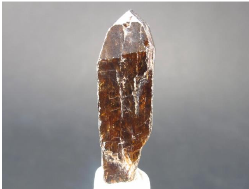
Slika 4. Kristal ksenotima dugačak oko 3 cm.