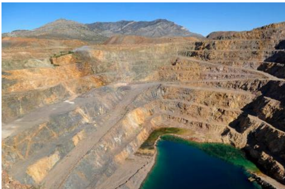
Slika 7. Mountain Pass površinski iskop u Kaliforniji.

Velike koncentracije minerala i sirovina bogatih REE nalaze se i u Sjedinjenim Američkim Državama. Najviše se ističe mineralno ležište Mountain Pass u Kaliforniji (slika 7). Nastanak ležišta veže se uz intruziju karbonatitne magme u već postojeće magmatske i metamorfne stijene (gnajsevi, graniti i migmatiti) tvoreći jedno od važnijih svjetskih ležišta REE. U sastavu intruzije koja tvori navedeno ležište glavni minerali su kalcit, dolomit i barit, a najvažniji rudni mineral REE je bastnäsit. Prekambrijske je starosti, otkriveno 1949. godine. Rudarenje i izvoz sirovina REE započeli su 1952., a 2002. godine dolazi do zatvaranja zbog štetnog utjecaja na okoliš. Na ovom ležištu rudarenje i eksploatacija se vršila isključivo zbog REE, dok su u većini ostalih rudnika REE nusprodukt koji ima dobru ekonomsku vrijednost pa se zbog toga eksploatira (Walters i sur., 2015).