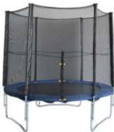
Slika br. 33: trampolin