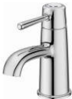
Slika br. 25: slavina GRANSKAR