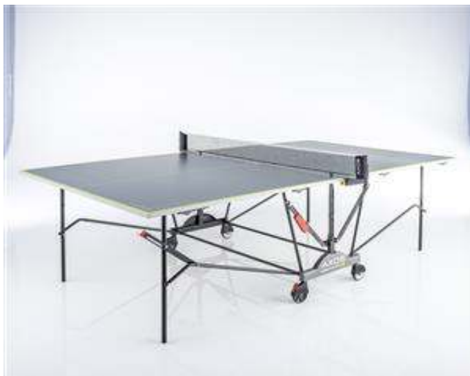
Slika br. 31: stol za stolni tenis Kettler

- Stol za stolni tenis Kettler Axos OUTDOOR 2, vanjski 33