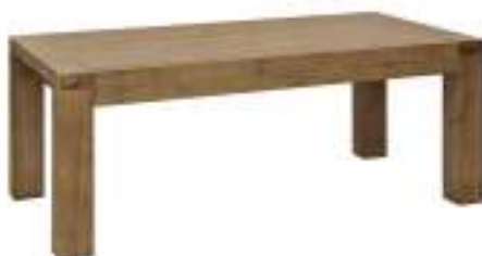
Slika br. 19: stolić za dnevni boravak ARCADIA