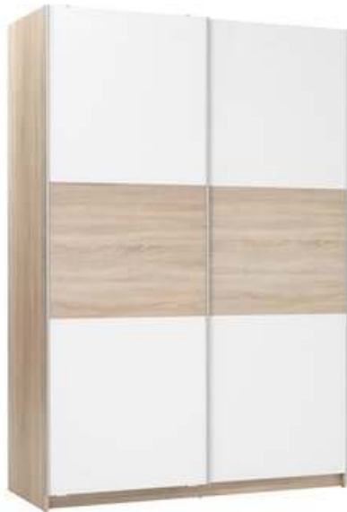
Slika br. 15: ormar SATTRUP

Ormar od melamina u boji hrasta i bijeloj boji. S dvama kliznim vratima, dvije police i dvije šipke za vješalice. Veličina: Š150xV218xDub62 cm.