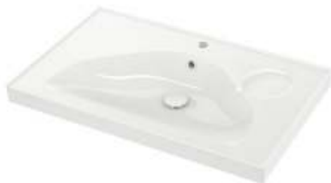
Slika br. 24: umivaonik EDEBOVIKEN