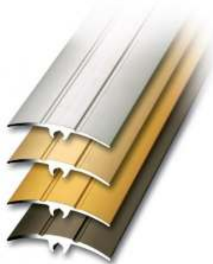
Slika br. 7: brončana lajsna