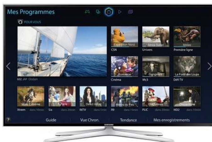
Slika br. 21: tv SAMSUNG

- SAMSUNG UE48H6400 LED TV, FULL HD, Smart 3D TV