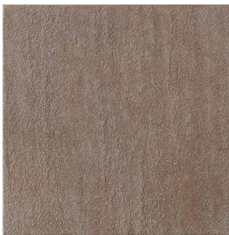
Slika br. 3: Langhe cortemilla podne pločice za kupaonicu