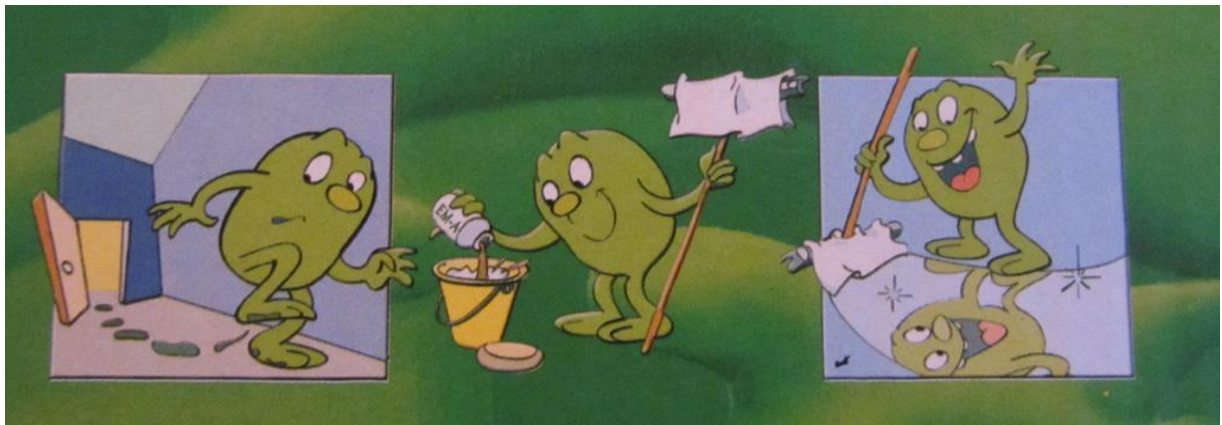
Slika 1. Čišćenje upotrebom EM ( http://chilesinstockholm.blogspot.hr/2012/09/effective-microorganisms.html )

( http://www.emtehri.com/view.asp?idp=7&c=3 , 2015.).