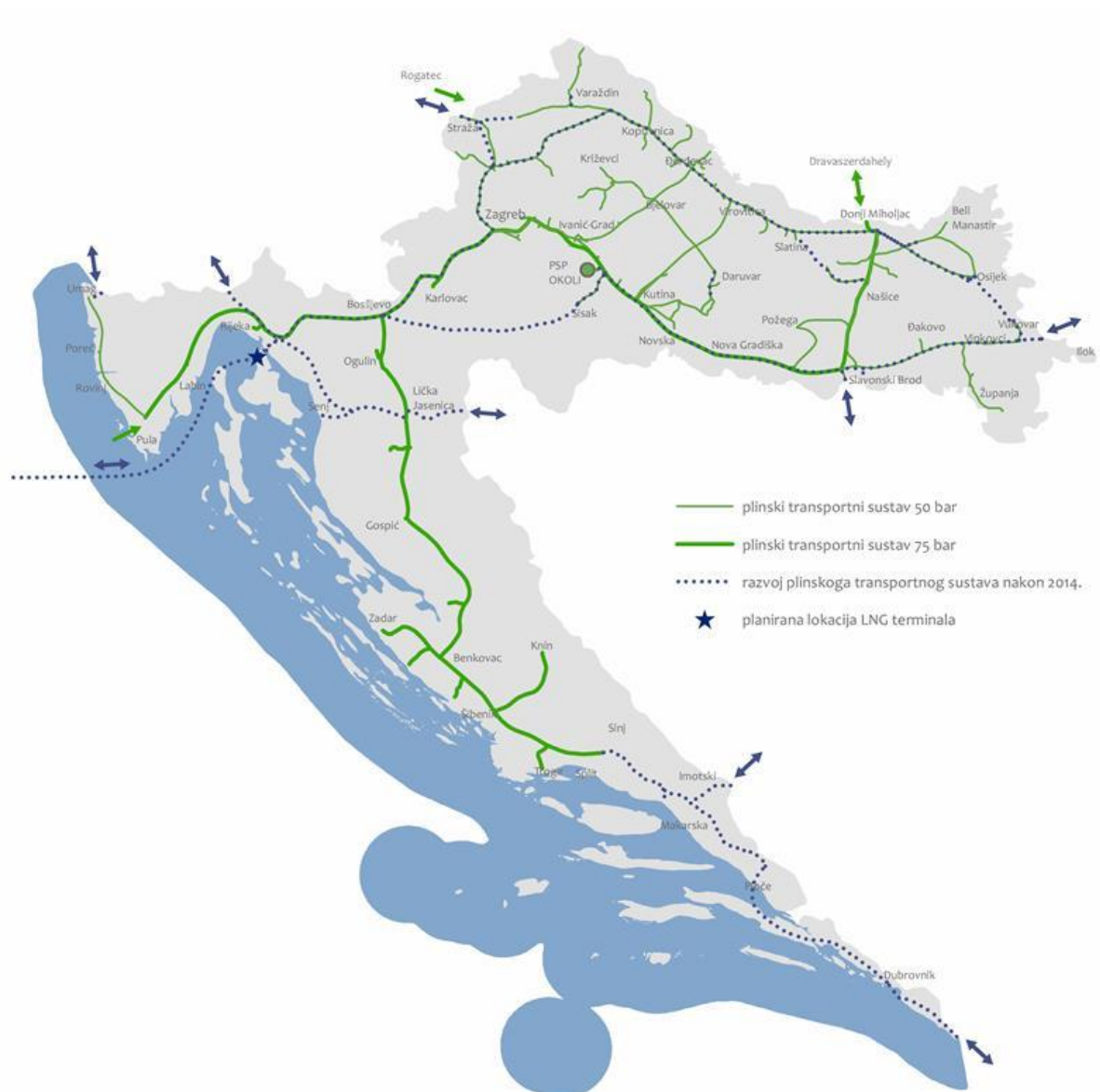
Slika 2-2. Plinski transportni sustav u Republici Hrvatskoj (Plinacro, 2017.)

Kako bi hrvatsko plinsko tržište bilo integrirano s europskim tržištem plina, zadaća operatera plinskog transportnog sustava jest izgraditi međudržavne spojne plinovode ili po potrebi povećati kapacitete postojećih uzimajući u obzir ekonomski razumne i tehnički izvodive zahtjeve. Pri tome je ključna suradnja i razmjena informacija s institucijama Europske unije čija je obveza praćenje planova razvoja transportnog sustava (Ministarstvo zaštite okoliša i energetike, 2017.).