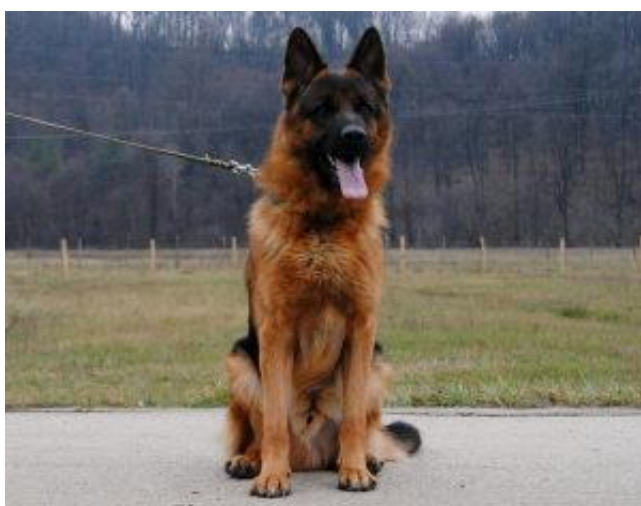
Slika 4: Pas pasmine njemački ovčar