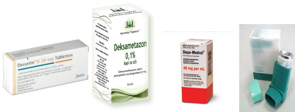
Slika 2. Kortikosteroidni lijekovi s različitim načinima primjene. Preuzeto: (12)

Prirodni kortikosteroidi i njihovi derivati brzo se i potpuno apsorbiraju nakon peroralne primjene; biološki aktivan dio se brzo i razgrađuje u jetri, a izlučuje se urinom. Mogu se primijeniti i topikalno (kreme, masti) i inhalacijom (pumpice za bolesti dišnih puteva). (11)