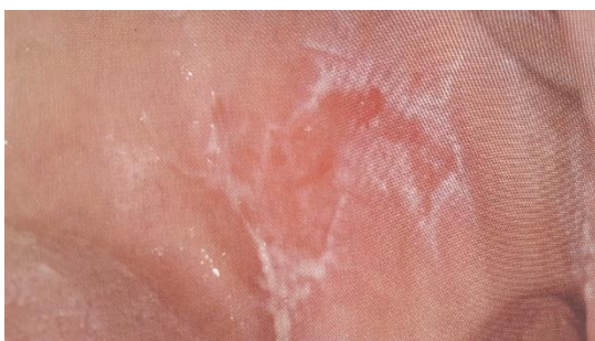
Slika 4. Erozivni lichen ruber. Preuzeto: (17)