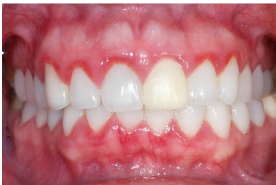
Slika 3. Gingivitis. Preuzeto: (16)

U stomatologiji se kortikosteroidi koriste u liječenju upalnih promjena sluznice (koje nisu uzrokovane mikroorganizmima) kao što su: alergijske promjene, traumatski ulkusi, deskvamirajući stomatitis i gingivitis, erozivni lichen planus , erythema exudativum multiforme , pemphigus .