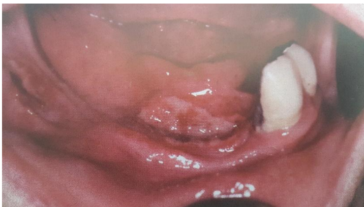
Slika 8. Dekubitalni ulkus. Preuzeto: (17)

Kortikosteroidi mogu izazvati pojačanu osjetljivost na infekcije, aktivaciju kroničnih zaraznih žarišta (TBC), te usporiti cijeljenje rana. (11)