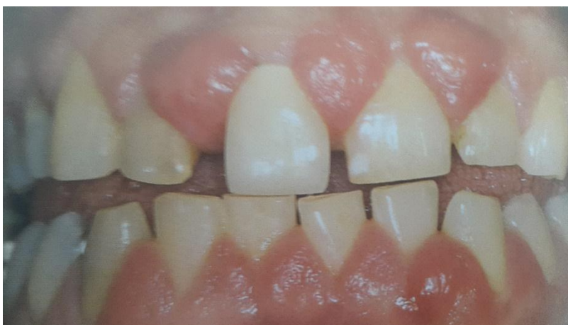
Slika 9. Hiperplazija gingive. Preuzeto: (18)

Do hiperplazije gingive obično će doći prilikom krorištenja velikih doza kombiniranih lijekova (ciklosporin, azatioprin, prednizon) nakon presađivanja organa. (18)