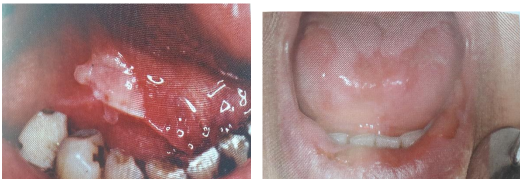
Slika 5 i 6. Pemphigus vulgaris i erythema exudativum multiforme. Preuzeto: (17).

Prije primjene kortikosteroida potrebno je isključiti infekcije uzrokovane mikroorganizmima, napose virusima (herpesa) kod kojih je primjena kortikosteroida kontraindicirana. Primjenjuju se lokalno, a u težim slučajevima i sistemno. Treba voditi računa da je kod pacijenata pod terapijom kortikosteroidima smanjena otpornost na infekciju i usporeno je cijeljenje rana te je potrebno provoditi asepsu. Ovi lijekovi se ne bi trebali primjenjivati kod hipersenzibilnog cervikalnog dentina ili pulpotomija zbog moguće infekcije bakterijama ili bi pacijente trebalo zaštititi antibioticima.