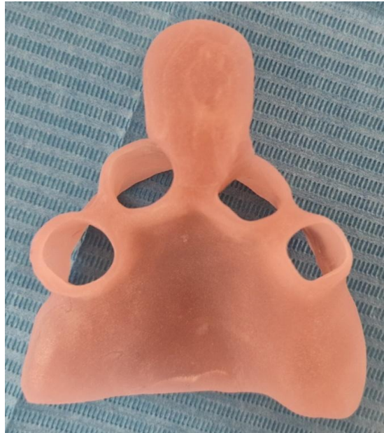
Slika 2. Individualna žlica za otisak u implantoprotetici

Individualna je žlica napravljena po anatomskom modelu pacijenta iz svjetlosno polimerizirajućega ili autoakrilata (Slika 2). Individualne žlice u potpunosti obuhvaćaju strukture koje se otiskuju i omogućavaju jednoličan sloj otisnog materijala. Time se smanjuje deformacija materijala pri vađenju materijala iz usta kao i polimerizacijska kontrakcija (3).