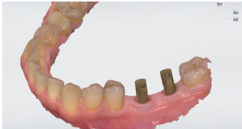
Slika 5. Skenirane posebno dizajnirane nadogradnje

Geometrija posebno dizajniranih nadogradnji varira od sferičnoga do cilindričnog dizajna s različitim oblicima između tih oblika. Visina komercijalno dostupnih nadogradnji za skeniranje kreće se 3 – 17 mm (26).