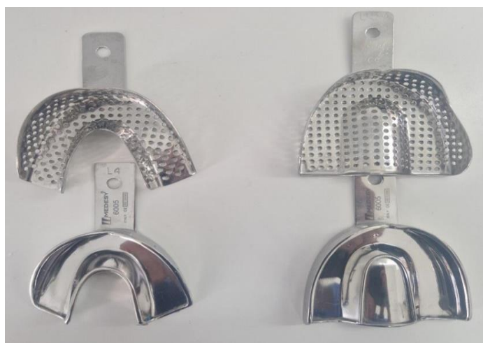
Slika 1. Konfekcijske žlice za otiske

Konfekcijske žlice za otiskivanje (Slika 1) metalne su žlice. Za mehaničku retenciju otisne mase imaju zadebljani rub ( rimlock ) ili perforacije. Podijeliti se mogu na žlice za gornju i donju čeljust, ozublenu, djelomično ozublenu ili bezubu čeljust. Da bi se žlica smatrala odgovarajućom potrebno je da udaljenost ruba žlice i zubnoga luka iznosi 3 – 5 mm (3).