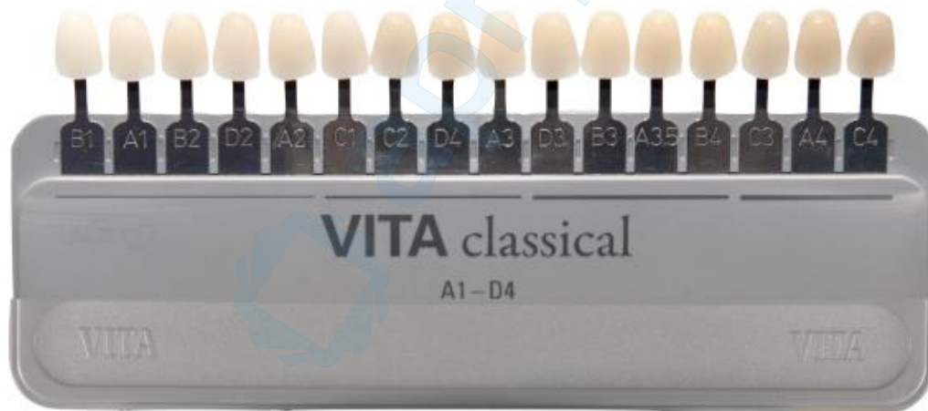
Slika 2. Distribucija boja u Vita Classical ključu prema nijansi.