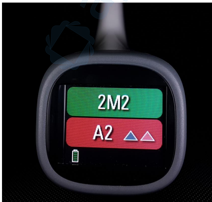
Slika 19. Rezultati mjerenja boje zuba 12 VITA Easyshade LITE spektrofotometrom