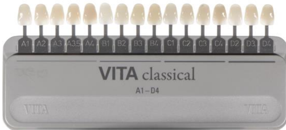
Slika 1. Distribucija boja u Vita Classical A1-D4 ključu prema nijansi (A1 – A4 (crvenkasto-smečkasta), B1 – B4 (crvenkasto-žučkasta), C1 – C4 (sivkaste nijanse), D2 – D4 (crvenkasto-siva).