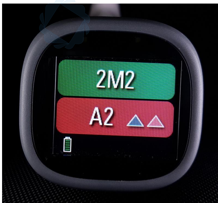
Slika 22. Rezultati mjerenja boje zuba 22