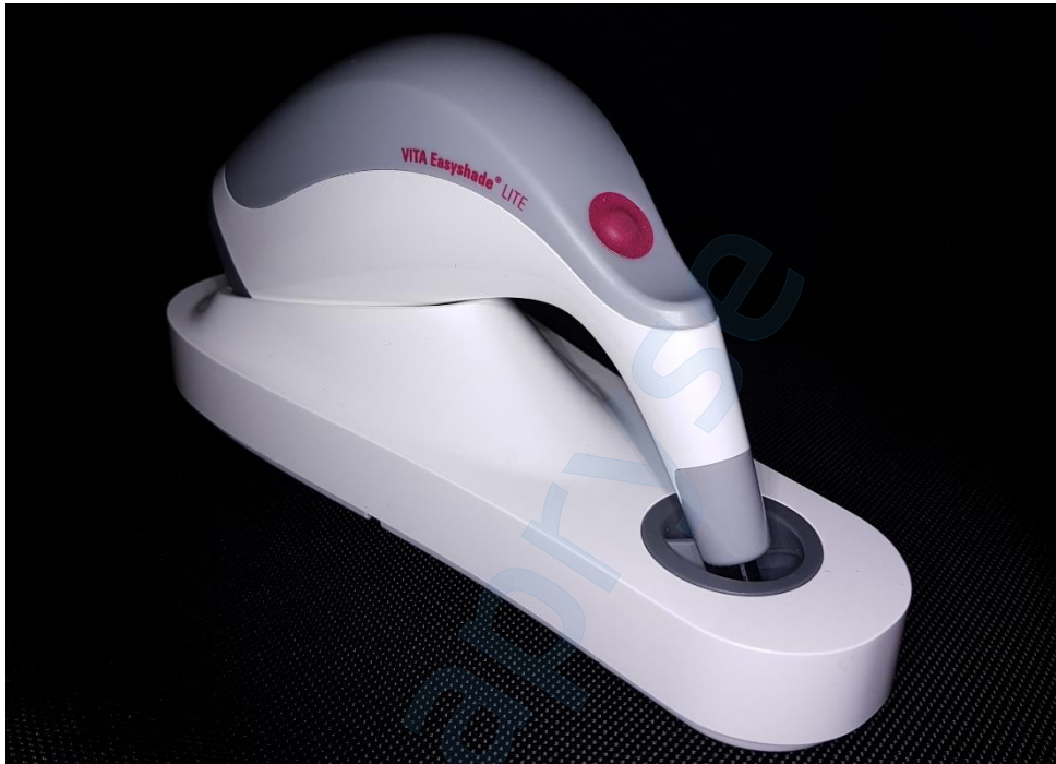
Slika 4. VITA Easysshade LITE na pločici za kalibriranje

Prikazat će se postupak mjerenja boje prednjih zuba VITA Easysshade LITE spektrofotometrom (Slika 1. – Slika 8.). Spektrofotometar omogućuje brzo i precizno određivanje boje prirodnih zuba pomoću jednog klika. Kompaktan i jednostavan dizajn čine ga praktičnim alatom za određivanje boje zuba koristeći referentne vrijednosti VITA Classical A1 – D4 ključa boja i VITA 3D-Master sustava (12). Mjerenja će se usporediti i s mjerenjima VITA Easysshade V spektrofotometrom (Slika 9., Slika 10.).