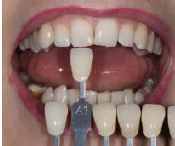
Slika 3. Određivanje boje zuba pomoću Vita Classical ključa boja, boja A1 odgovara boji promatranog zuba.

Noviji i unaprijeđeni sustav vizualnog određivanja boje zuba je VITA 3D Master linearni ključ boja. Postupak izgleda tako da se najprije odredi stupanj svjetlosti od 0 do 5 koji najbolje odgovara promatranom zubu koristeći tamnosivu pločicu ključa boja. Na temelju odabira svjetline uzima se odgovarajuća VITA Chroma/Hueguide (0/1, 2, 3, 4 ili 5) siva pločica za određivanje odgovarajućeg tona i zasićenosti. Sastoji se od 26 prirodnih i sustavno raspoređenih boja zuba i tri dodatne boje za izbjeljivanje zubi (10).