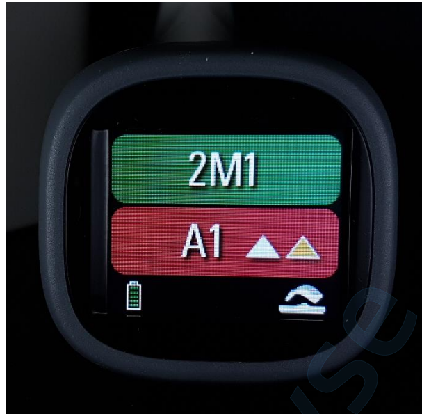
Slika 13. Prikaz rezultata mjerenja boje zuba 11 VITA Easyshade LITE spektrofotometrom

podudaranje i estetski prihvatljiv rezultat (Tablica 1.,2.,3.), što u VITA Classical sustavu nije slučaj.