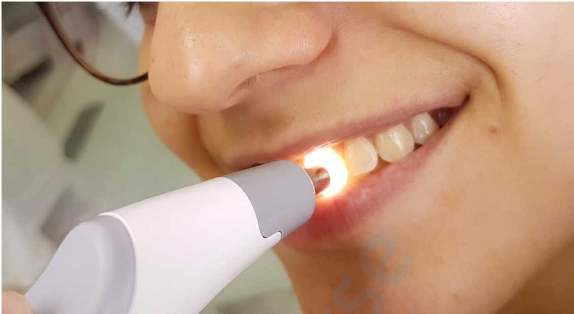
Slika 15. Mjerenje boje zuba 21

Slika 15. prikazuje pozicioniranje mjerne sonde pri mjerenju boje zuba 21.