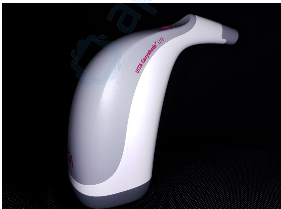
Slika 6. VITA Easyshade LITE