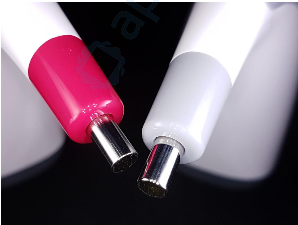
Slika 10. Mjerne sonde VITA Easyshade V (lijevo) i VITA Easyshade LITE (desno)