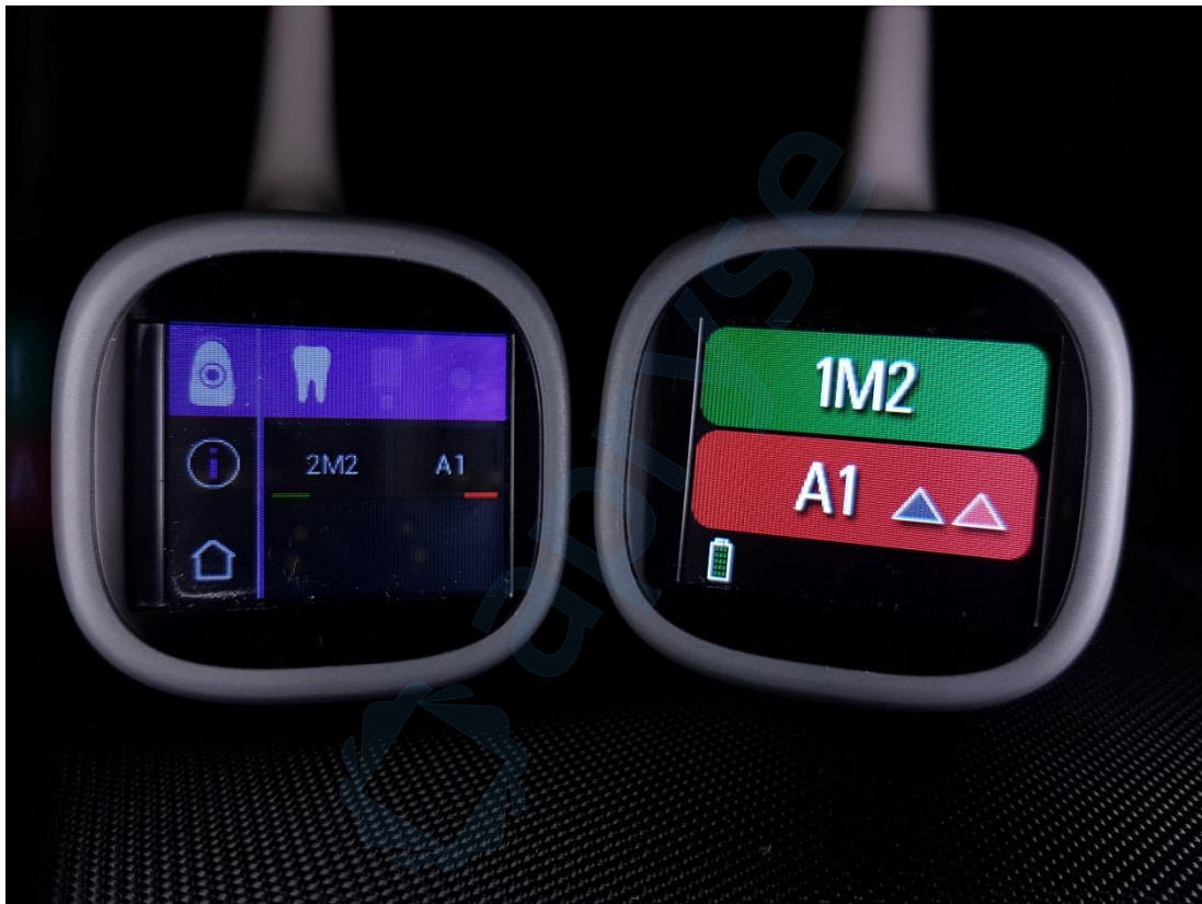
Slika 17. Usporedba rezultata mjerenja boje zuba 21 VITA Easyshade V (lijevo) i VITA Easyshade LITE (desno) spektrofotometrom

Izmjerena je različita nijansa u VITA 3D Master sustavu, no obje su označene zelenom bojom, što znači da obje izmjerene boje odgovaraju boji zuba. To se može objasniti polikromatskom prirodom zuba te nemogućnošću da se oba spektrofotometra primjene na identičnom položaju na zubu.