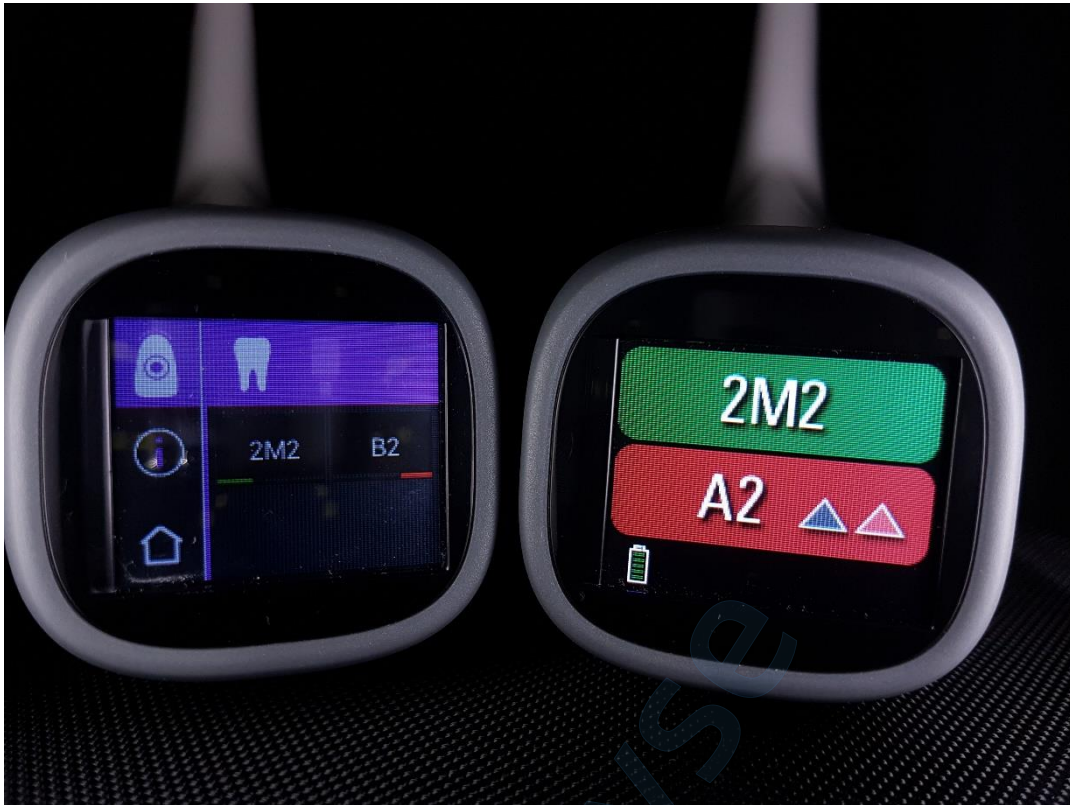
Slika 20. Usporedba rezultata mjerenja boje zuba 12 VITA Easysshade V (lijevo) i VITA Easysshade LITE (desno) spektrofotometrom