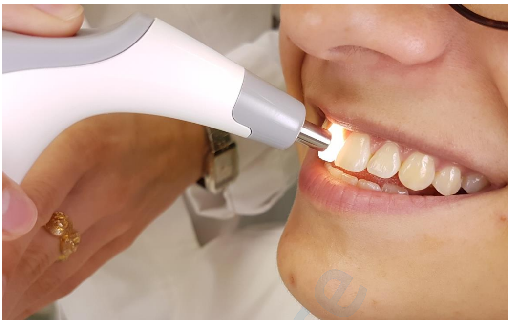
Slika 12. Mjerenje boje zuba 11

Na Slici 13. prikazani su rezultati mjerenja boje zuba 11 VITA Easyshade LITE spektrofotometrom. Gornji red prikazuje rezultate mjerenja u VITA 3D Master sustavu, a donji red u VITA Classical sustavu.