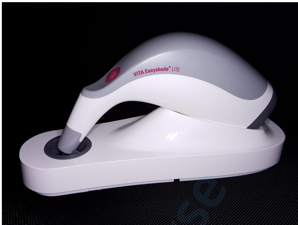
Slika 5. VITA Easyshade LITE na pločici za kalibriranje