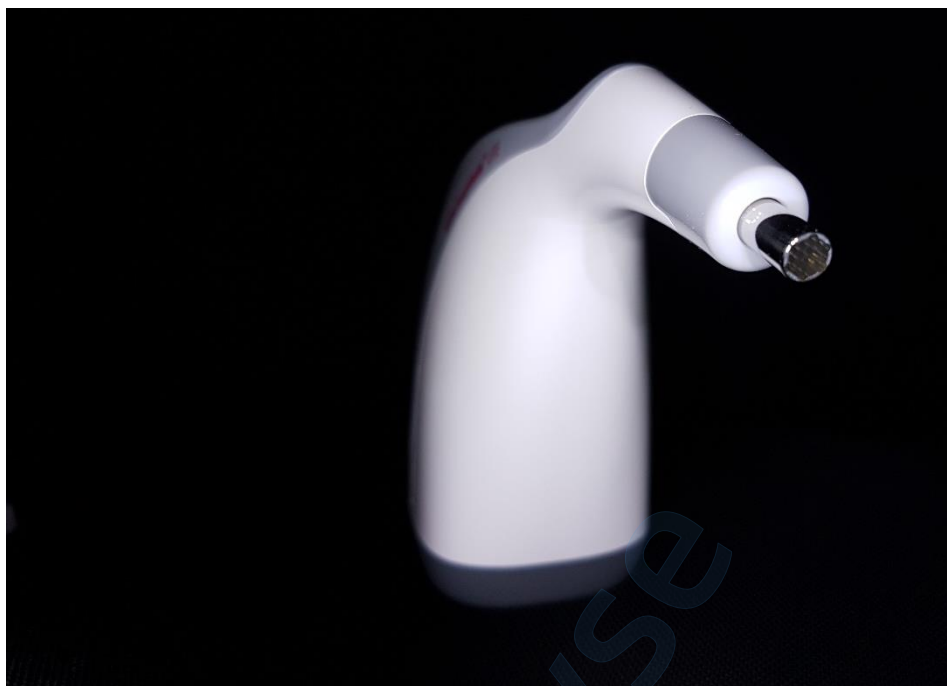
Slika 7. VITA Easyshade LITE, mjerna sonda