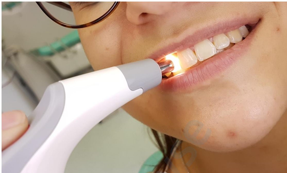
Slika 18. Mjerenje boje zuba 12

su označene crvenom bojom što znači da boja zuba ima jasno prepoznatljivo odstupanje od izmjerene vrijednosti te boju treba dodatno prilagoditi i podesiti.