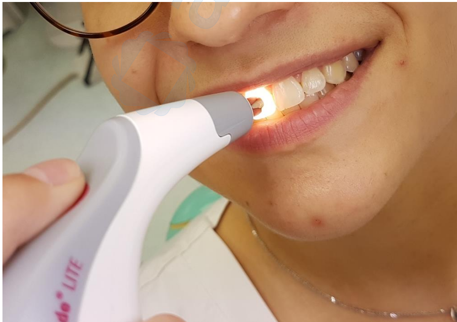
Slika 11. Prikaz mjerenja boje zuba 11

Prije početka mjerenja pacijent treba biti u stabilnom i uspravnom položaju s glavom naslonjenom na naslon za glavu radi stabilizacije kako bi se postigla točnost mjerenja. Za mjerenje osnovne boje zuba uređaj se pozicionira u središnjoj regiji zuba (Slika 11.). Mjerna sonda se postavi na područje cakline s podležecim dentinom, centralno od cervikalnog područja. Također, treba paziti da mjerna sonda leži što ravnije moguće na površini zuba i da ga jednakomjerno dodiruje (Slika 12.). Za analizu mjerenja važno je naglasiti da mjerač mjeri boju na dubini od 1.4 mm (u dentinu) (7).