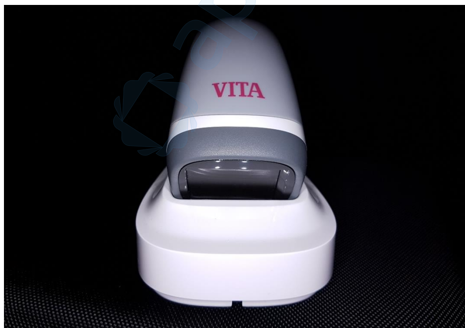
Slika 8. VITA Easyshade LITE, ekran za prikaz