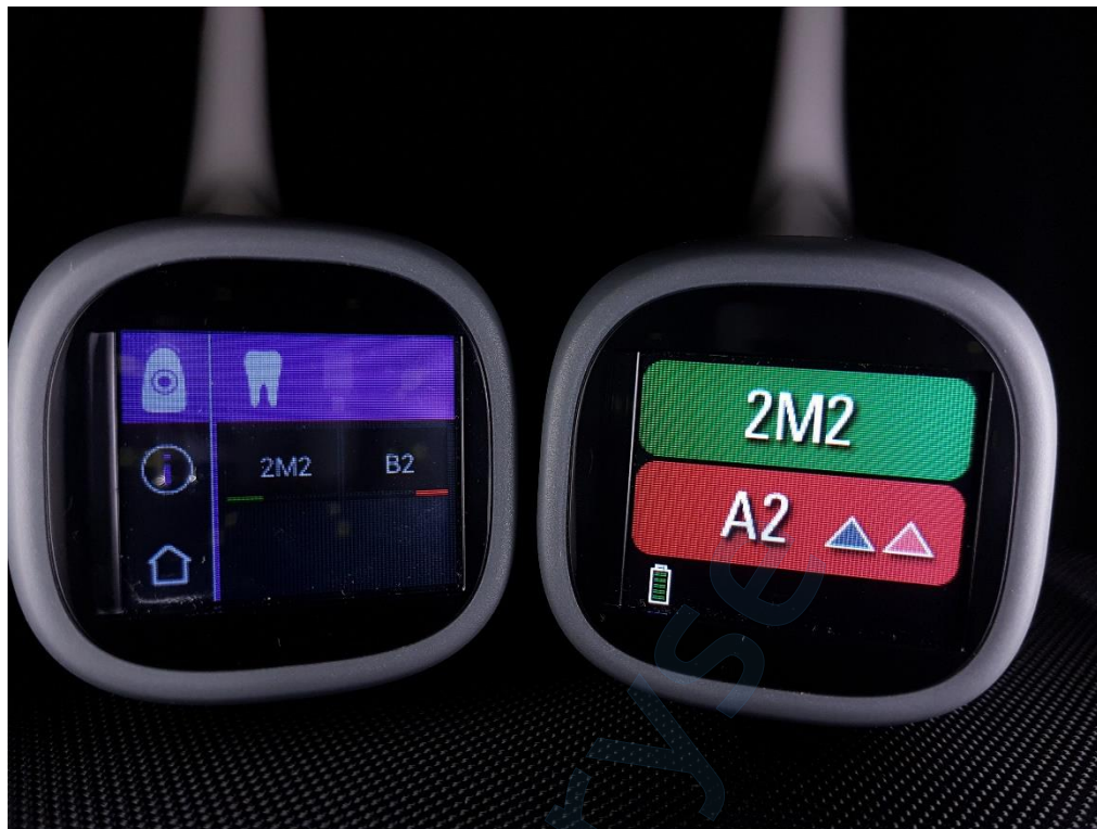
Slika 23. Usporedba rezultata mjerenja boje zuba 22 VITA Easyshade V (lijevo) i VITA Easyshade LITE (desno) spektrofotometrom