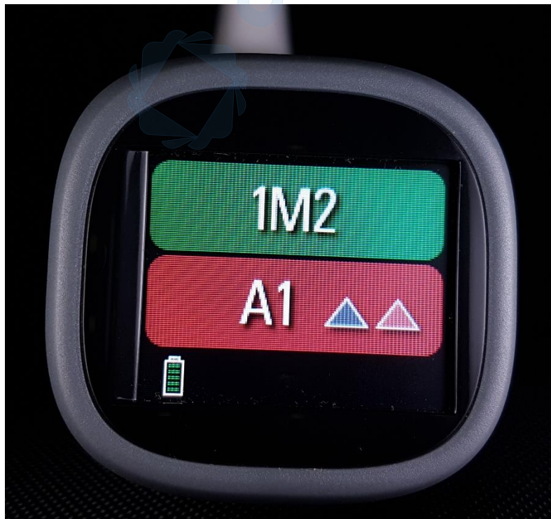
Slika 16. Rezultati mjerenja boje zuba 21 VITA Easyshade LITE spektrofotometrom

Na Slici 16. prikazani su rezultati mjerenja boje zuba 21 VITA Easyshade LITE spektrofotometrom. Gornji red prikazuje odgovarajuću boju u VITA 3D Master sustavu, donji red prikazuje boju u VITA Classical sustavu, no stvarna boja zuba je tamnije i crvenkastije nijanse od prikazane izmjerene vrijednosti.