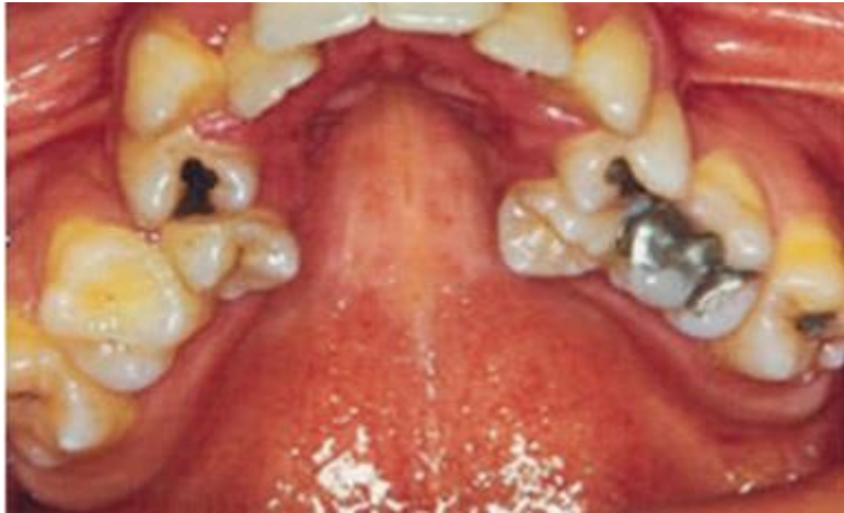
Slika 2. V-oblik maksilarnog luka.

Gingiva je crvena i upaljena zbog stalne izloženosti zraku. Često je prisutan i „gummy smile“, a u stražnjoj regiji križni zagriz.