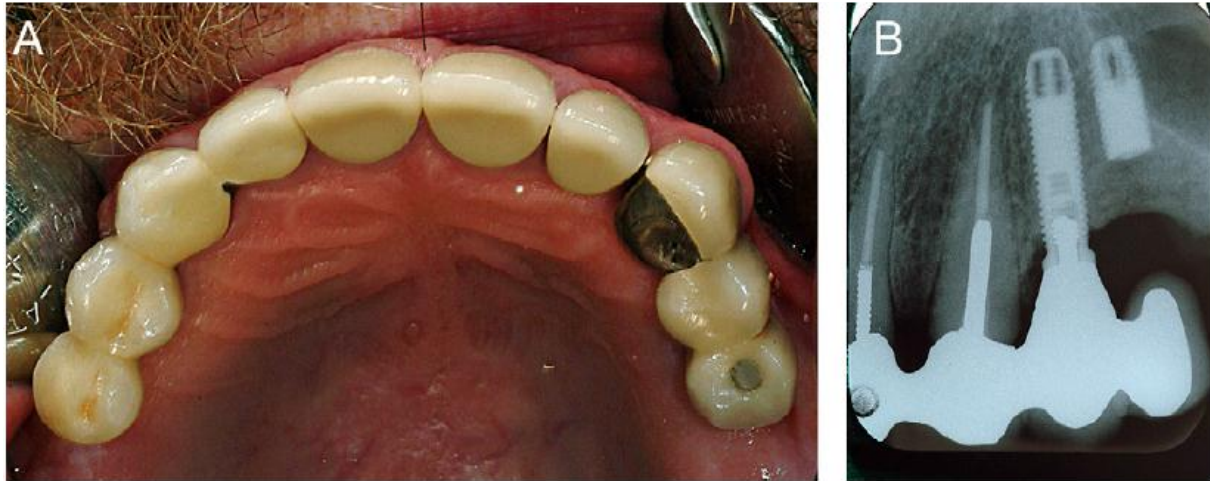
Slika 2. 57-ogodišnji pacijent s frakturom implantata na poziciji 25 uzrokovanoj preopterećenjem. Preuzeto s dopuštenjem (27).

otpuštanje protetskog vijka, odcementiranje, frakture protetskog dijela tzv. „chipping“ keramike, frakture baze proteze i proteznih zuba (39).