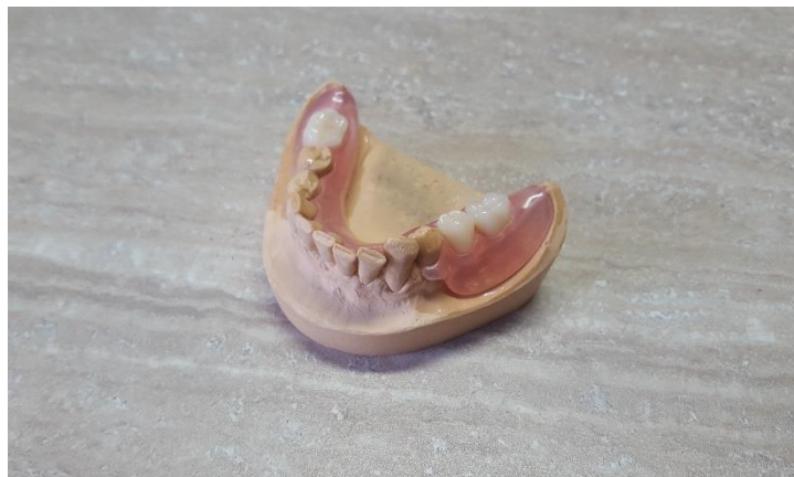
Slika 15. Završena donja djelomična poliamidna proteza