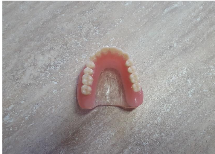
Slika 14. Ispolirana gornja potpuna poliamidna proteza s prozirnim nepčanim baznim dijelom

postojanija veza s umjetnim zubima. S druge strane, s obzirom na kombinaciju elastičnog (poliamid) i rigidnog (akrilat) materijala mogući su lomovi akrilatnih dijelova.