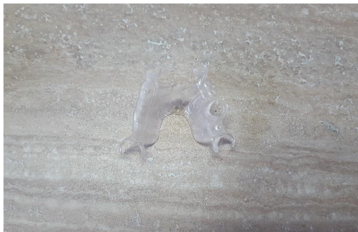
Slika 9. Skelet proteze (poliamid)

Hlađenje materijala se odvija u kivetama, postepeno. Tijekom 30 minuta se hlade na zraku, da bi se zatim hladile 20 minuta pod vodom. Proces se ne smije požurivati da se ne potkradu greške. Skelet proteze se odvaja od sadre i obrađuje (Slika 9).