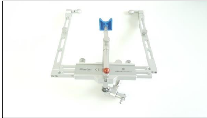
Slika 10. Obrazni luk