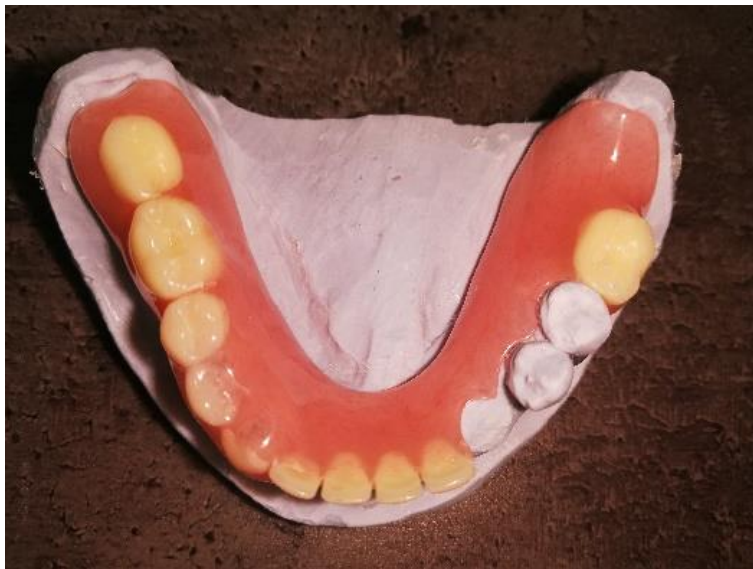
Slika 8. Privremena akrilatna proteza

isplativosti. U svakom slučaju pacijenta treba uputiti u način održavanja oralne higijene vlastitih zuba te higijene proteze (57).