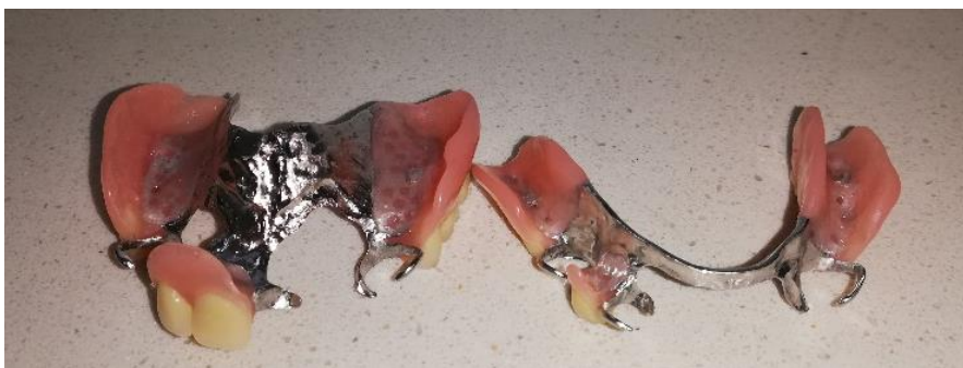
Slika 7. Djelomična akrilatna proteza poduprta metalnim skeletom

Sve se više teži uporabi neplemenitih legura bez nikla zbog njegove povezanosti s nastankom alergijskih reakcija. Danas su u upotrebi slitine bez nikla (npr. Wironit ili Wironium). Prednosti uporabe neplemenitih slitina za lijevanje mobilnih protetskih nadomjestaka jesu u tome što su lakše, što imaju bolja mehanička svojstva, tj. vrlo su tvrde, čvrste i otporne na trošenje i visoke temperature, a sadržavanje kroma čini ih otpornima na elektromehaničku koroziju (37).