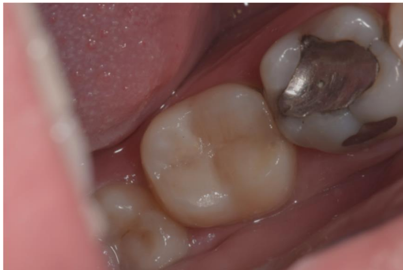
Slika 8. Zamijenjen amalgamski ispun kompozitnim materijalom na zubu 47.