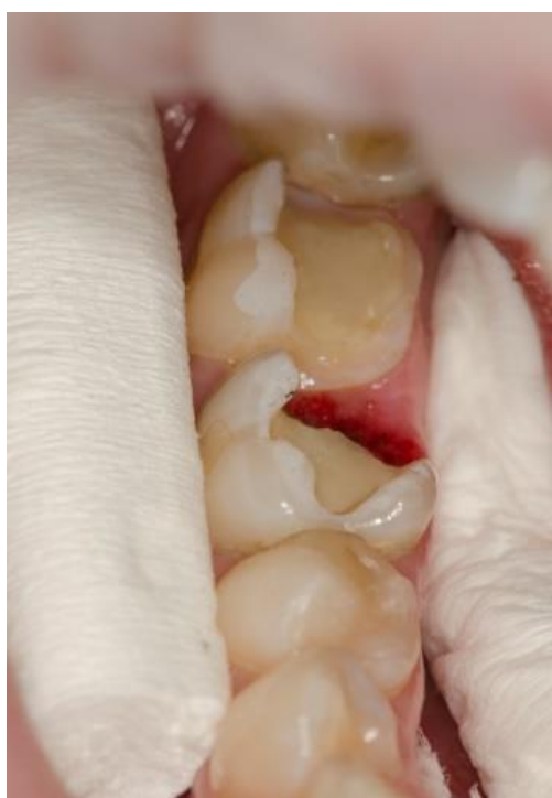
Slika 13. Preparacija kaviteta s divergentnim zidovima.