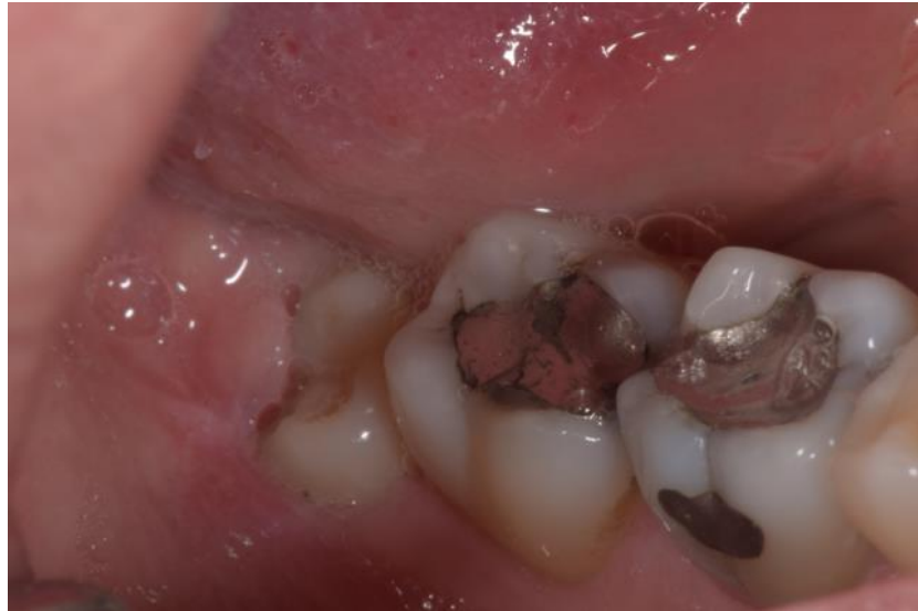
Slika 7. Stari amalgamski ispun na endodontski liječenom zubu 47.