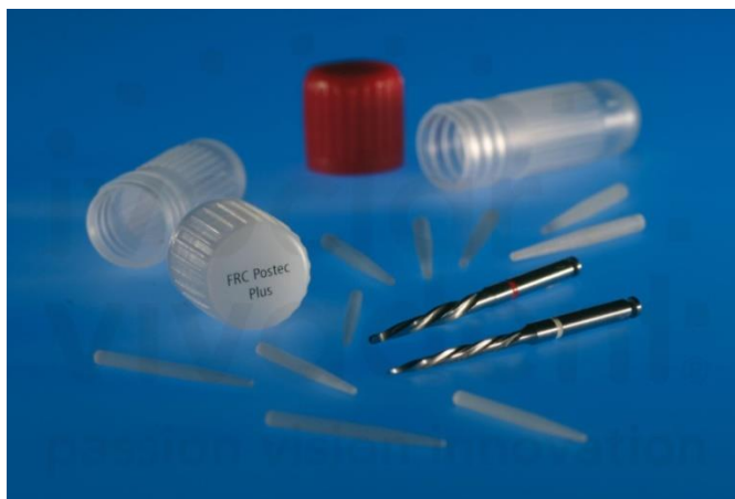
Slika 3. Kompozitni intrakanalni kolčići sa svrdlima za izradu intrakanalnog ležišta.

Kolčići, koji se temelje na kompozitnim materijalima, mogu sadržavati radioopakna karbonska vlakna (karbonski), polietilenska ili staklena vlakna. Karbonski kolčići posjeduju dobra biomehanička svojstva i modul elastičnosti sličan dentinu (30-40 GPa, dentin 15-25 GPa) (12). Otporni su na koroziju i biokompatibilni. No, nedostatak im je crna boja. S druge strane, kompozitni kolčić pojačan staklenim vlaknima bijele je boje i biokompatibilan (Slika 3). Modul elastičnosti sličan je dentinu (15 GPa), a u kombinaciji s adhezijskim cementiranjem ostvaruje čvrstu retenciju (12).