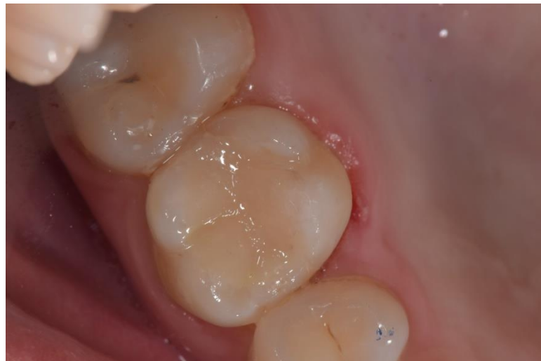
Slika 11. Kompozitni ispun na endodontski liječenom zubu 16.