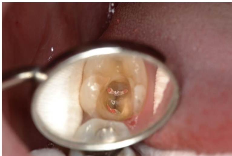
Slika 12. Endodontski liječen zub 37.