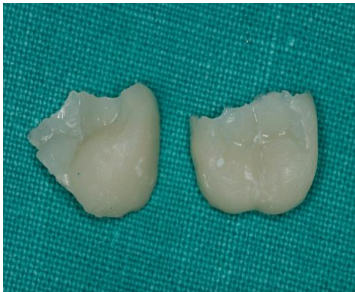
Slika 15. Indirektni kompozitni ispuni.