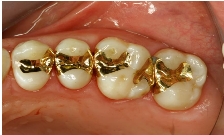
Slika 18. Zlatni indirektni ispun

a to podrazumijeva radikalno odstranjivanje tvrdih zubnih tkiva prilikom preparacije (36) (Slika 18).