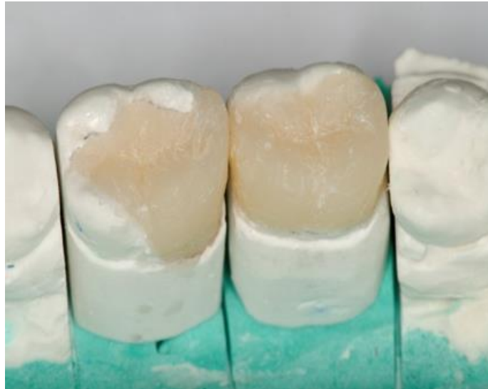
Slika 14. Izrada indirektnoga kompozitnog ispuna na modelu.