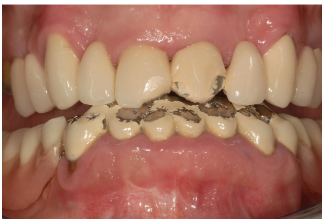
Slika 5. Aktricija psihijatrijske pacijentice na antidepresivnoj terapiji inhibitorom ponovne pohrane serotoninom (preuzeto iz 24)

Iako za sada nisu identificirani geni, koji bi mogli biti direktno odgovorni za bruksizam, promatranja su pokazala da 21–50% bruksista ima u obitelji nekog s manje ili više izraženom kliničkom slikom bruksizma (9). Važno je napomenuti provocirajući učinak alkohola, duhana, malnutriciju, poremećaje sna (13). Veća učestalost bruksizma je uočena kod ovisnika o drogama kao kokain i amfetamini (22), te kod pretjeranog konzumiranja proizvoda s kofeinom (23). Može biti povezan s Huntingtonovom bolešću, Parkinsonom, atipičnom facijalnom boli (13). Lijekovi također mogu uzrokovati bruksizam (16), a među njima su agonisti dopamina, triciklički antidepresivi, levadopa itd. (24) (Slika 5).