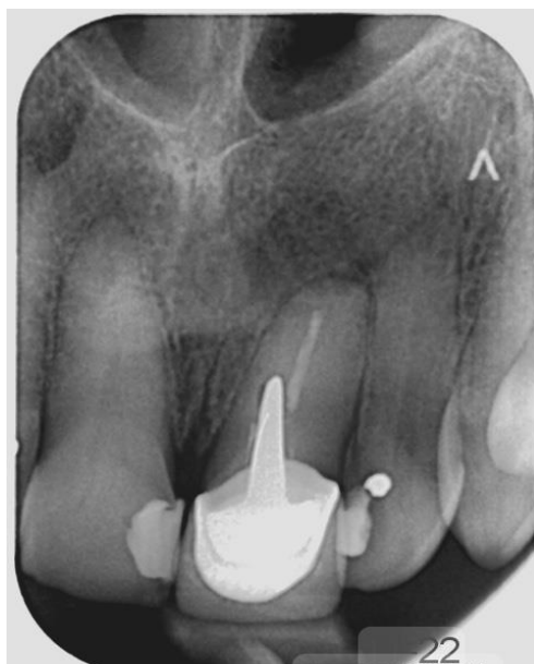
Slika 15. Kontrolna rendgenska snimka nakon 9 mjeseci