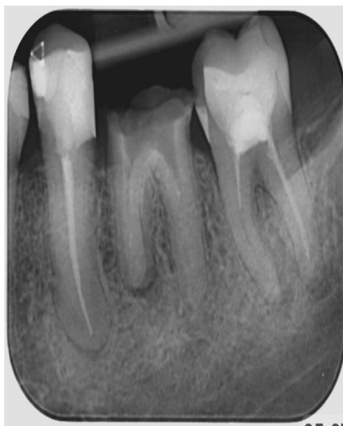
Slika 18. Kontrolna rendgenska snimka zuba 35 nakon 10 mjeseci