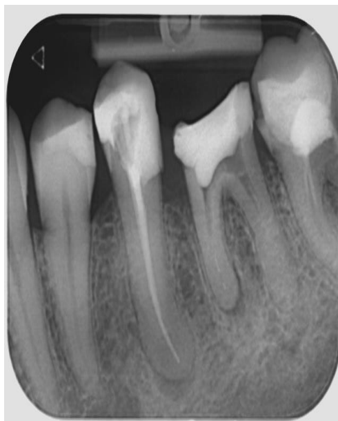
Slika 17. Rendgenska snimka zuba 35 nakon punjenja kanala