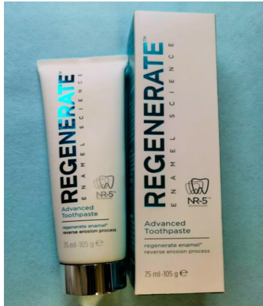
Slika 2. Regenerate Enamel Science zubna pasta