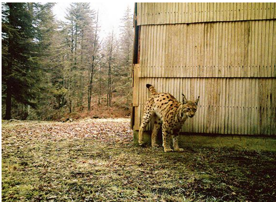
Slika 7.: Euroazijski ris uhvaćen fotozamkom Državnog zavoda za zaštitu prirode