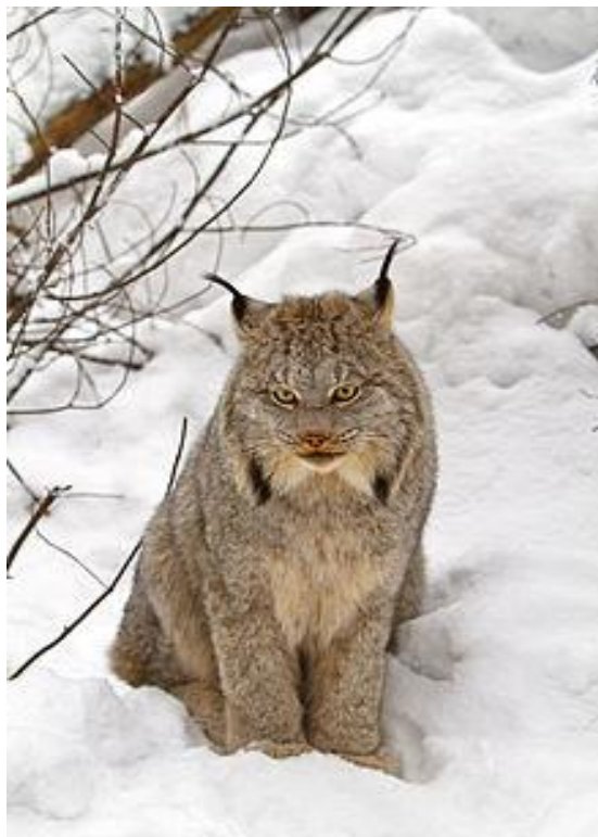
Slika 4. Kanadski ris ( Lynx canadensis )