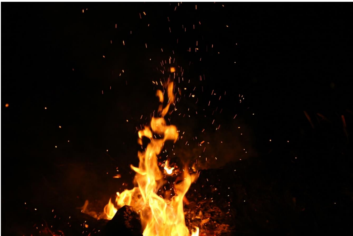
Slika 2. Plamen

Da zaustavimo vatru, jedan od tri elementa vatre trokuta mora biti uklonjen. Ako vatra ostane bez goriva ili se smanji toplina ili ostane bez kisika, ugasit će se. Tako da su pokušaji borbe protiv požara te prevencije požara bazirani na upravo ovim principima.