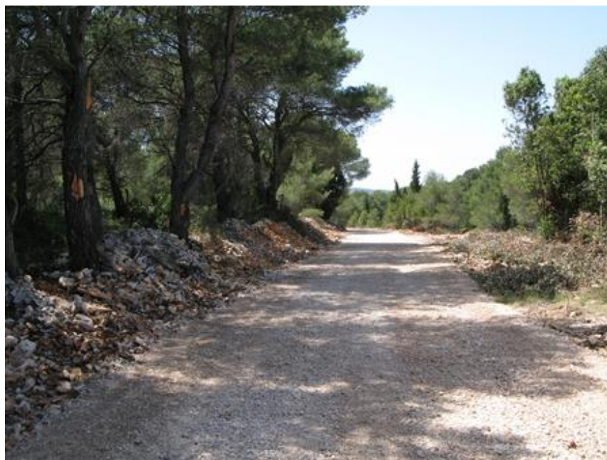
Slika 6. Protupožarni put

Pravne osobe koje temeljem posebnih propisa imaju obvezu održavanja javnih prometnica dužne su na bankinama i razdjelnom pojasu cesta uz šume razvrstane u I. i II. stupanj opasnosti od šumskog požara pokositi travu do početka lipnja, na području unutrašnjosti i u rujnu, a cestovni pojas očistiti od lakozapaljivih tvari, suhe trave i korova, suhog šiblja, granja i drveća, papira, otpadaka i drugih tvari koje bi mogle izazvati požar ili preko kojih bi se požar mogao širiti.