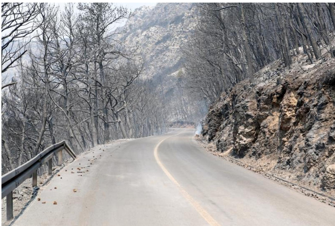
Slika 4. Pelješac nakon požara

Neposredne štete su puno veće i teško nadoknadive u bliskoj budućnosti