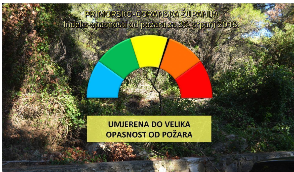
Slika 3. Primjer indeksa opasnosti od požara u požarnoj sezoni

U Dalmaciji 70% požara nastaje u srpnju i kolovozu dok u Istri i Primorju isti omjer izbija od veljače do travnja. Požarna sezona obuhvaća ljetne mjesece, kada su oborine niske i temperatura visoka, dolazi do isušivanja tla i vegetacije odnosno visokog rizika od požara. Najkritičnije kalendarsko razdoblje što se tiče šumskih požara je dakle srpanj i kolovoz kada izbije gotovo 90% šumskih požara na teritoriju Hrvatske.