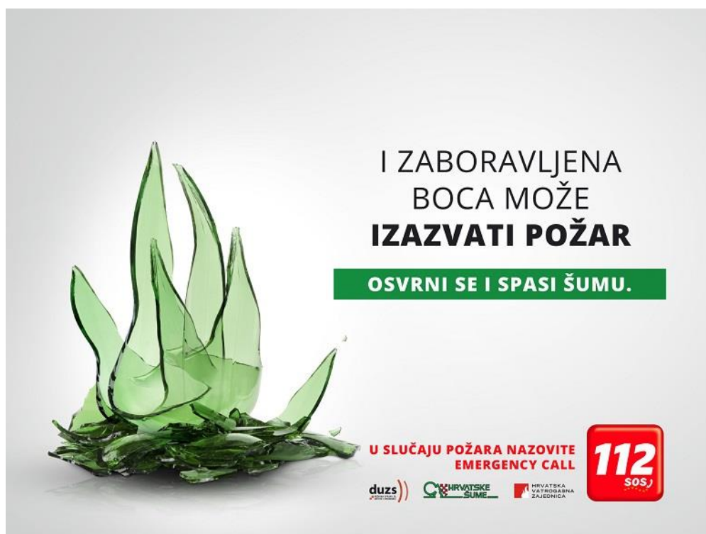
Slika 5. Protupožarna propaganda

Oslanjanje na prevenciju označava opću potrebu u borbi za zaštitu šuma od požara, u procesu smo mijenjanja fizičkih, društvenih i ekonomskih uvjeta koji su povezani sa izbijanjem požara, poboljšava se edukacija a prisila se primjenjuje kao krajnja mjera. Zbog jakih sezona požara i preklapanja sa turističkom sezonom, jaka protupožarna propaganda je potrebna.