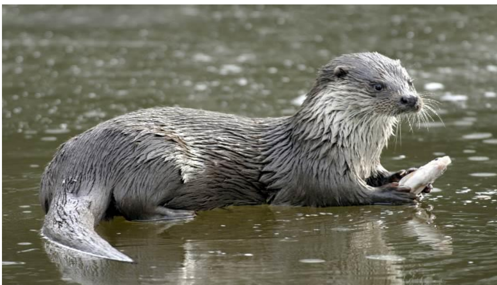
Slika 1. Vidra

Kako bi se vidra zaštitila, treba osigurati djelotvorniju zaštitu od krivolova i onemogućiti ilegalnu prodaju te preradu koža i krzna. Pri izgradnji prometnica treba planirati i izgraditi prolaze za vidre. Također treba zaustaviti daljnje onečišćenje i kanaliziranje prirodnih vodotoka. S obzirom na to da je vidra nedovoljno istražena, trebalo bi organizirati istraživanje sadašnjeg stanja i brojnosti vrste te praćenje stanja (Tvrtković, Flajšman, 2006).