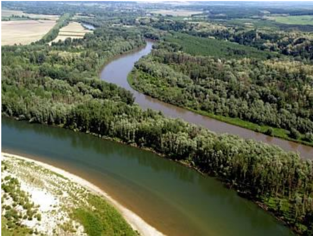
Slika 1. Usporedan tok Mure i Drave prije samog ušća kod Legrada

korito Drave sačuvano je jedino između akumulacija te djelomice u starim tokovima. Priobalje Mure i Drave u Hrvatskoj i Mađarskoj predstavlja jednu tek rijetko očuvanu oazu prirodnog okoliša u srednjoj Europi, stoga je i razumljivo veliko zanimanje europske i hrvatske ekološke javnosti za njegovo očuvanje (Feletar, 2013).