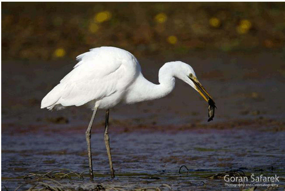
Slika 2. Velika bijela čaplja (Autor: Goran Šafarek)