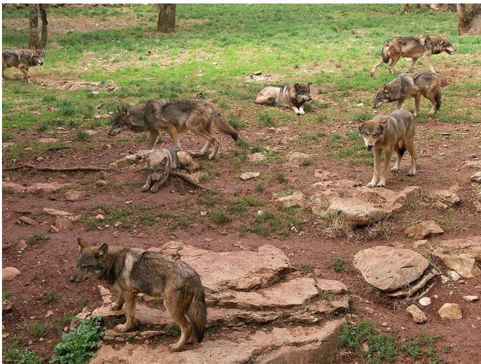
Slika 2 Čopor vukova

Sivi vuk je vrsta koja živi u manjem ili većem čoporu. Čopor je obiteljska zajednica, hijerarhijski ustrojena, koju čini jedan reproduktivni (dominantni) par vukova, štenad i njihova starija braća i sestre. Dakle, roditeljski par vukova ima dominantan položaj, dok ostali međusobno grade nadređeni i podređeni odnos. Ovaj način života smatra se evolucijskim napretkom jer vukovi love poglavito krupni plijen (jelene, srne i divlje svinje) te živeći u skupini mogu lakše uhvatiti plijen i odmah ga pojesti, tj. posve iskoristiti (Poklar, 2013.) Veličina čopora ovisi o količini hrane na tom prostoru. O tome kada će se ići u lov i gdje će biti brlog odlučuje dominantan vuk ili vučica. Samo dominantna vučica u čoporu može imati mlade, što je jedan od mehanizama samoregulacije veličine populacije vuka, a time je spriječeno i parenje u srodstvu. Može se reći da vodstvo čopora u vrijeme parenja preuzme vučica jer ona odlučuje gdje će se okotiti, što znači da o njezinoj odluci ovisi na kojem će području čopor živjeti i loviti dok je štenad još premalena za praćenje čopora (Kusak, 2002.). Položaj dominantnog para se zadržava sve do smrti jednog člana tada, da ne bi došlo do raspada čopora, potrebno je da čopor prihvati stranog vuka istog spola kao nastradala jedinka te taj vuk postaje novi član reproduktivnog para.