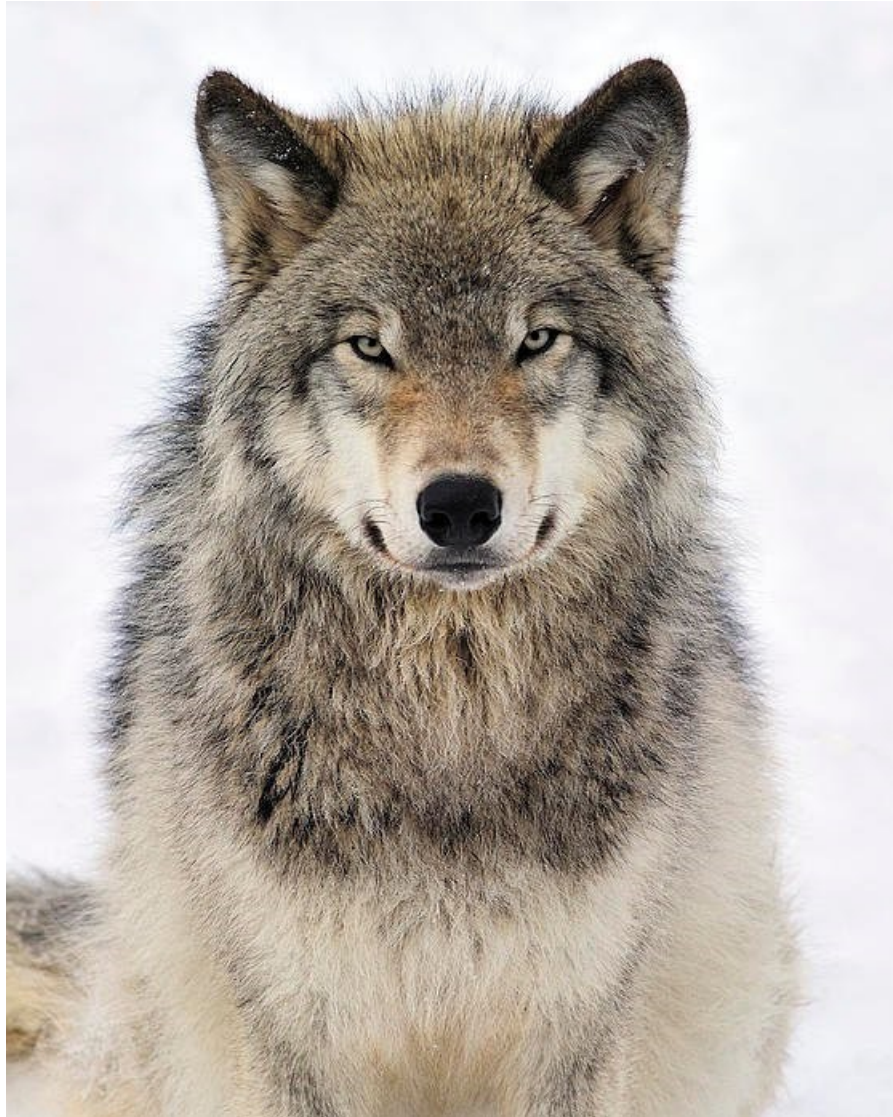
Slika 7 Sivi vuk ( Canis lupus L.)

Brane koje su sagradili pružili su stanište patkama, vidrama, ribama reptilima i vodozemcima. Razvojem šume promijenili su se i vodotoci rijeka, smanjile su se erozije, suzila su se korita, formiralo se više bazena i više slapova što je pogodovalo bujanju vegetacije i životinjskog svijeta. Istraživanje navodi kako je samo 14 vukova uspjelo u svega 21 godinu transformirati ne samo ekosustav parka već i fizički, njegovu geografiju. Osigurati hranu i mjesto za život brojnim životinjskim vrstama koje je čovjek protjerao ubijajući vukove kao grabežljivce.