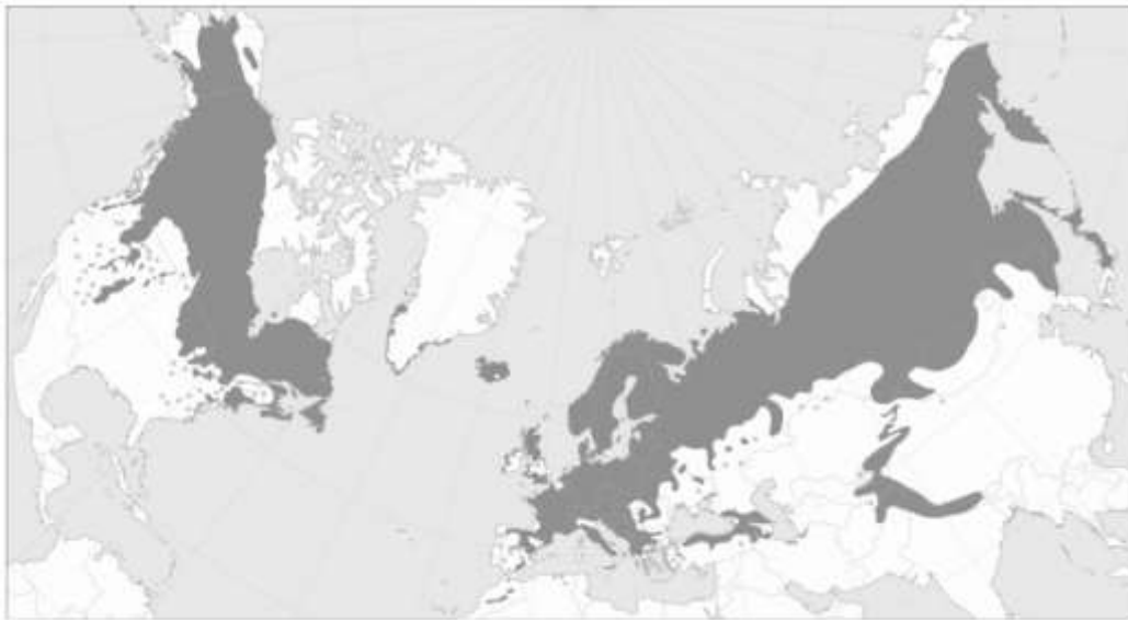
Slika 4. Prirodna rasprostranjenost Juniperus communis

Obična borovica je vrsta izrazito široke ekološke valencije te je najrasprostranjenija četinjača na Zemlji, čiji areal obuhvaća cijelu sjevernu polutku, tj. sjevernu Afriku, čitavu Europu, srednju i sjevernu Aziju i Sjevernu Ameriku (Slika 4). U južnoj Europi rasprostire se u brdskim područjima. U svojim zahtjevima na bonitet tla je veoma skromna. Osim toga, dobro podnosi ne samo niske zimske temperature, nego i ekstremne ljetne temperature (Herman 1971).