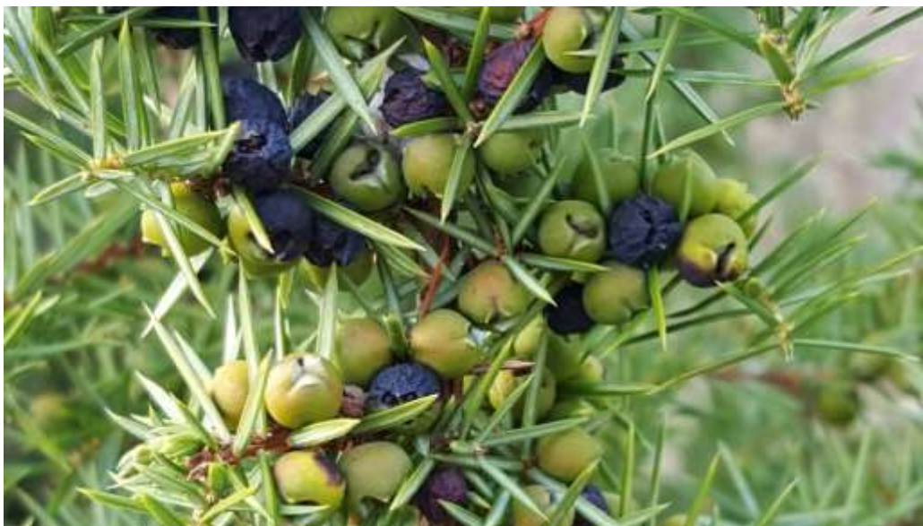
Slika 3. Igličasti listovi s bobuljastim češerima