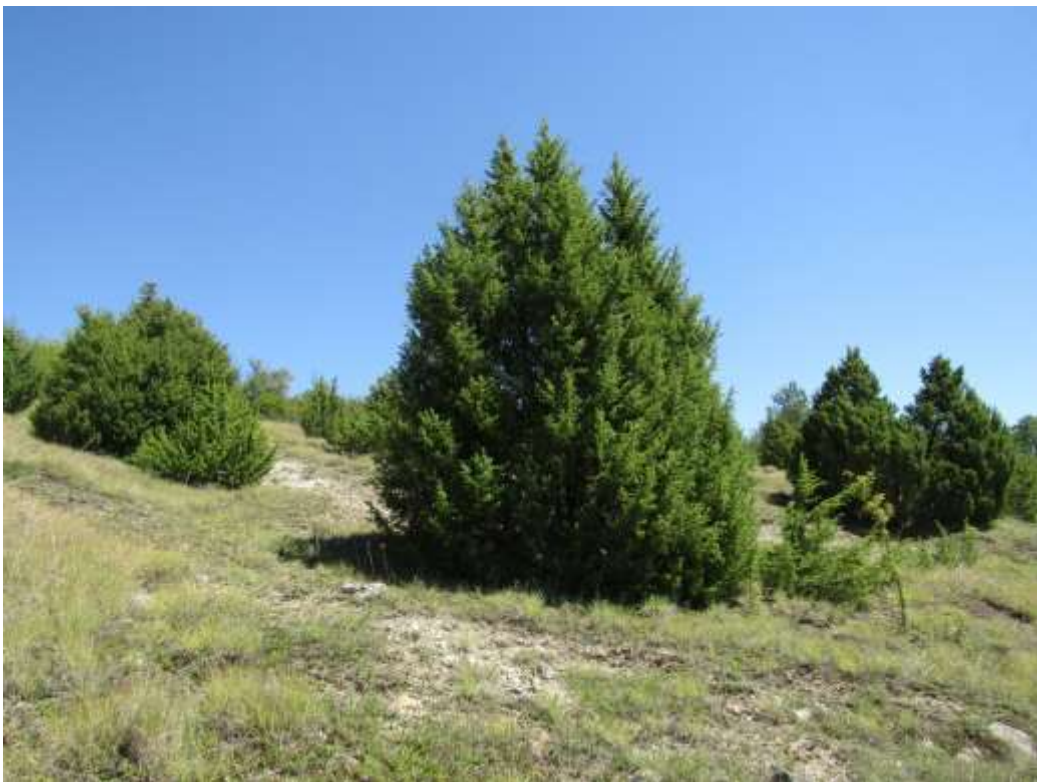
Slika 2. Habitus obične borovice