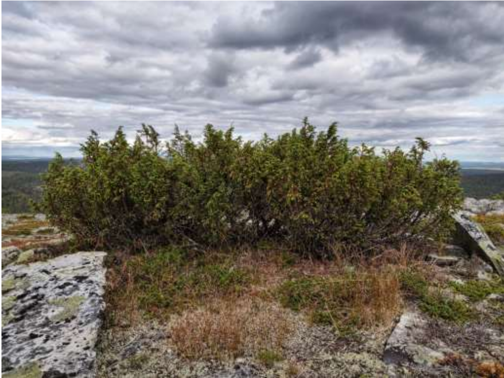
Slika 1. Juniperus communis u prirodnom staništu