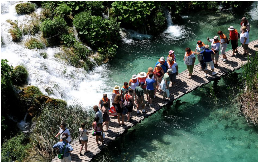
Slika 3. Plitvička jezera po ljeti bilježe milijunske posjete.

jednadžbu problema ubrajaju se i turisti, kojih je sve više. Ljeti Kozjačka draga više nalikuje trgovačkom centru u vrijeme rasprodaja nego iskonskoj divljini. Ispred električnih brodova koji posjetitelje odvoze u druge dijelove parka, vijuga red od nekoliko stotina ljudi, a niz cestu koja vodi prema pristaništu spušta ih se još toliko. Park ne investira dovoljno u lokalne zajednice (lokalne agencije i turističke zajednice nisu uključene u marketing Parka), potreban je novi prostorni plan kako bi stanovnici Parka mogli širiti svoje turističke kapacitete. Trenutačno Plitvička jezera ne nude raznoliku turističku ponudu, a posjetitelji ne mogu ni doći do informacija o alternativnim ponudama, koje bi trebale biti lako dostupne svima. Svejedno su Plitvička jezera naš nacionalni park sa najviše posjeta- u sezoni ih dnevno bude i više od 10.000, a ima ih sigurno i 100 kojima karta ispadne u vodu, 10 kojima kamera ispadne u vodu, masa stvari narušava prirodnu ravnotežu. Mostići, staze, vibracije ljudi, sve to djeluje na poroznu i mekanu sedru, te radi toga bi trebalo biti više nadzornika. Situacija u parku danas je da nekolicina nadzornika ne može biti prisutna na cijelom prostoru stalno, mnogi od njih imaju nedostatak znanja stranih jezika i interpretacijskih vještina.