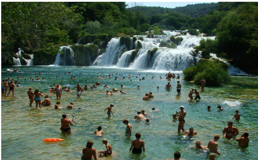
Slika 21. Kupači na donjem dijelu Skradinskog buka

Skradinski buk u Nacionalnom parku Krka vrvi kupačima, koji se pračkaju tek 20 metara od sedrenih slapova. Problem je ljeto, jer ljeti dolazi prevelik broj posjetitelja- u isto vrijeme na premalenom