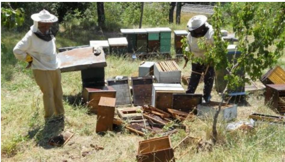
Slika 6. Štete od medvjeda u pčelarstvu

proizvodi med najviše kvalitete i gdje je pčelarstvo već sada, a u budućnosti će biti još i više, prioritetni dio razvojnih programa tih područja. Ocjenjuje se da na području staništa medvjeda stalno ili u selećem pčelarenju postoji više od 70 000 košnica.