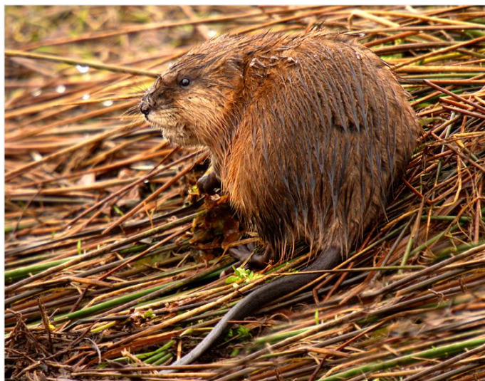
Slika 18. Bizamski štakor prilikom izlaska iz vode