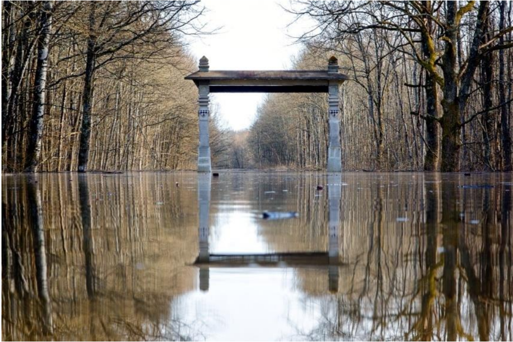
Slika 4. Turopoljski lug pod vodom