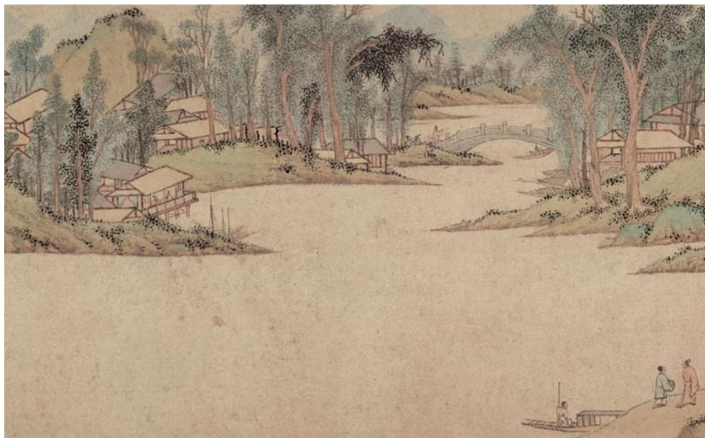
Slika 1: Wen Zhengming, " Huxi Thatched Cottage "

Ljepota prirode igra veliku ulogu u azijskoj umjetnosti od najranijeg doba. Priroda se slavi duž cijele istočne Azije pretačući njenu ljepotu u književnost, glazbu i umjetnost. U Kini su pejzaži bili više od pukog i doslovnog precrtavanja na papir prirode koja se prostirala ispred njihovih očiju i papira. Pejzaži su bili izražavanje srca i uma, zato su se umjetnici ponekad povlačili u prirodu kako bi izravno upijali njenu ljepotu, inspiraciju i snagu. Literati su osjećali duhovnu povezanost s prirodom te su najčešće slikali bambuse, ptice, rijeke i planine. Vodeći inspiracijom, slikali su slobodnijim potezima kistova i bilo im je bitnije da se u slici osjeti emocija, a ne da je oku lijepa. Nakon slikanja na rad bi napisali pjesmu koja bi opisala njihovo stanje uma i emocije prenesene na sliku. To je promatraču dalo jedan sentimentalni dodir s umjetnikom tijekom njegovog procesa stvaranja.