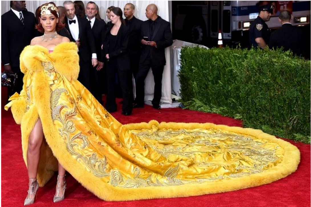
Slika 8: Rihanna u haljini Guo Pei na Met Gali