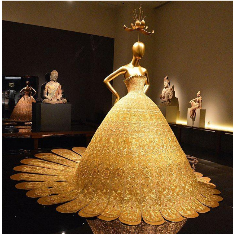
Slika 5: haljina " Magnificent Gold ", sa izložbe u muzeju Metropolitan

Kolekcija "Tisuću i dvije noći" debitirala je u Studenom 2009. godine. Tema kolekcije bila je emocija žene. Očigledno je inspirirana vrlo starom arapskom bajkom " 1001 noć ". Američki model, Carmen Dell'Orefice pojavila se na modnoj pisti u haljini obrubljenoj bijelim krznom s čak četiri asistenta kako bi joj pomogli nositi tešku haljinu. Kada su Carmen kasnije upitali kako se osjećala, odgovorila je da je to kao da ju pitate kako bi se osjećala vezano uz Zeffirellia te je sporedila Guo s engleskim haute couture dizajnerom Charles Jamesom. 3