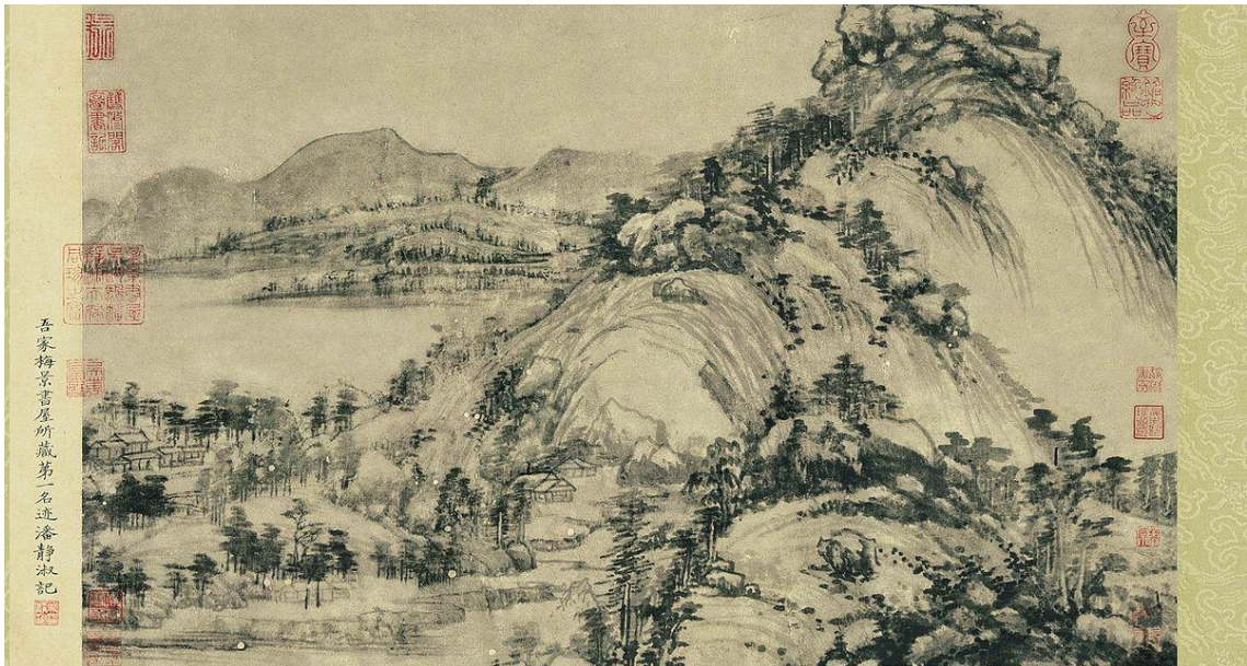
Slika 2: Huang Gongwang, "Dwelling in the Fuchun Mountains", 1350.

Huang je bio kineski umjetnik, rođen u trinaestom stoljeću u provinciji Jiangsu. Kao dijete izgubio je roditelje, nakon čega ga je pod svoje krilo uzeo Huang Le te mu promijenio ime u Huang Gongwang nakon što je uvidio koliko je bio talentiran. Bio je čudo od djeteta te je već s dvanaest godina učio postati majstorom znanja i vještine. Učitelj mu je bio Chao Meng-fu te je bio dio grupe zvane "Four Great Masters of the Yiin". Grupa je promijenila kinesko slikanje pejzaža. Huang je slikao na dva načina; jedan se fokusirao na ljubičastu tintu, a drugi na isključivo crnu. Smatrao je da slikati treba samo kada ste inspirirani što je bilo tipično razmišljanje literata . Starost je proveo u planinama gdje se posvetio glazbi, poeziji, pisanju i slikanju. Najviše djela je naslikao iza sedamdesetog rođendana. Umro je u dobi od osamdeset i šest godina te je iza sebe ostavio skoro jednu stotinu slika, ali nažalost samo je nekolicina opstala do danas. Najpoznatija slika je "Dwelling in the Fuchun Mountains" koju je naslikao 1350.