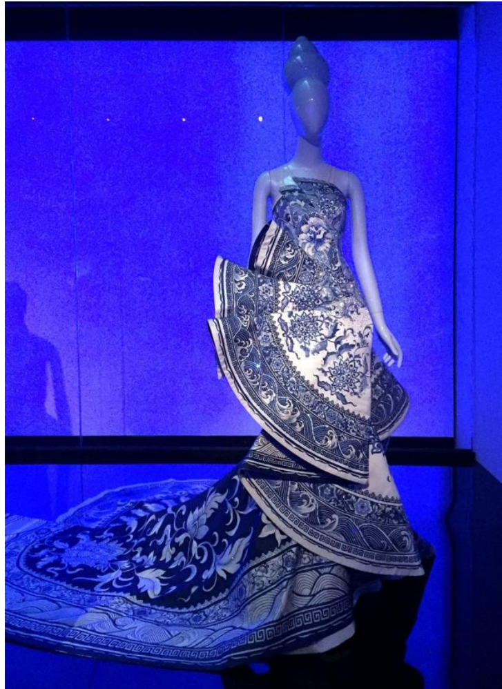
Slika 7: haljina Guo Pei, "Blue and Porcelain", na izložbi u muzeju Metropolitan

Guo je couture radila preko dvadeset godina u Kini prije nego što ju je Rihanna proslavila u cijelom svijetu. Haljinu nije radila posebno za Rihannu već je haljina dio kolekcije iz 2010. godine uz koju dolaze cipele i korzet koje je pjevačica odbila nositi. Stajala je u studiju tri godine prije nego što je Rihannin tim naišao na nju tražeći kineske haute couture dizajnere. Kada je Rihanna nazvala Guoinog muža da želi posuditi haljinu, Guo nije znala tko je ona. Ono što ju je zabrinjavalo je nesigurnost da li će Rihanna znati nositi haljinu ili će haljina nositi nju, jer za takvu haljinu treba imati veliko samopouzdanje i karakter. Zabrinjavalo ju je s razlogom jer je na reviji 2010. godine model jedva došao do pola piste zbog težine haljine te su morali ugastiti svjetla kako bi skinula sa sebe haljinu i što brže otišla s piste. Haljinu nitko nije nosio od iste revije sve do 2015. godine. Guo je bila jako zadovoljna kako Rihanna nosi haljinu jer ju je nosila onako kako je to Guo i zamišljala, s kraljevskim samopouzdanjem.