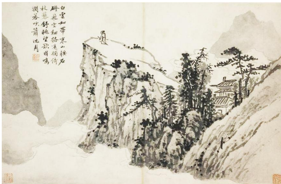
Slika 3: Shen Zhou, "Poet on a Mountaintop", 1500.

Shen je kineski umjetnik rođen 1427. godine u Xiangchengu na jugu provincije Jiangsu tijekom vladavine dinastije Ming. Obitelj mu je bila imućna te nikada nije radio službeni posao, već je uživao dugačak život koji je izučavao poeziju, slikarstvo i kaligrafiju. Smatra se jednim od četiri majstora dinastije Ming. Njegove slike sadrže dozu samopouzdanja, mirnoće i suptilne topline. Doprinio je kineskom slikarstvu otvaranjem nove škole u Suzhou nazvana "Wu" škola u kojoj je zauvijek ovjekovječeno slobodno izražavanje umjetnika. Uzori su mu bili Yuan slikari, do četrdesete godine Wang Meng, te Huang Gongweng i Wu Zhen poslije četrdesete godine. Iako najpoznatiji po slikanju pejzaža, motivi su mu bili i cvijeće, voće, povrće i životinje koje slikao monokromatski tušem. Bio je među prvim literatima koji je počeo slikati cvijeće te je tako pokrenuo novu tradiciju. Jedan od velikih kineskih umjetnika umro je 1509. godine u osamdeset drugoj godini života te za sobom ostavio pregršt umjetničkih djela koja su bila inspiracija daljnjim naraštajima umjetnika.