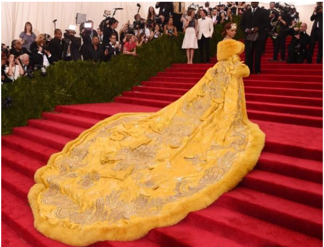
Slika 9: Rihanna u haljini Guo Pei na Met Gali