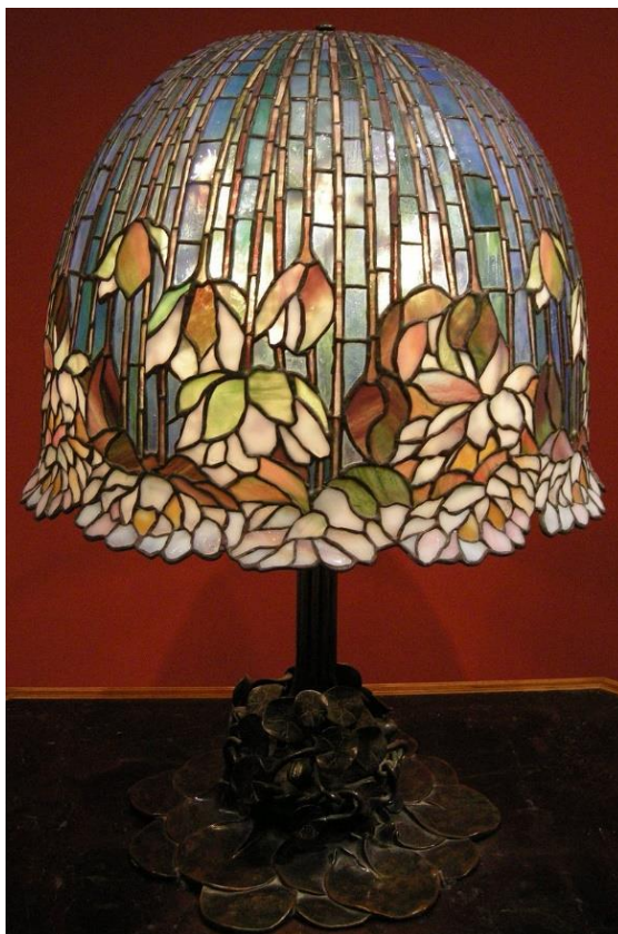
Slika 10. Louis Comfort Tiffany, svjetiljka, 1900.

Što se nakita tiče, René Lalique, Louis Comfort Tiffany i Marcel Wolfers stvorili neke od najcjenjenijih dijela na prijelaza stoljeća, proizvodeći gotovo sve, od naušnica do ogrlica, narukvica, broševa, pa se i danas Art Nouveau povezuje s luksuznim fin-de-siecle komadima.