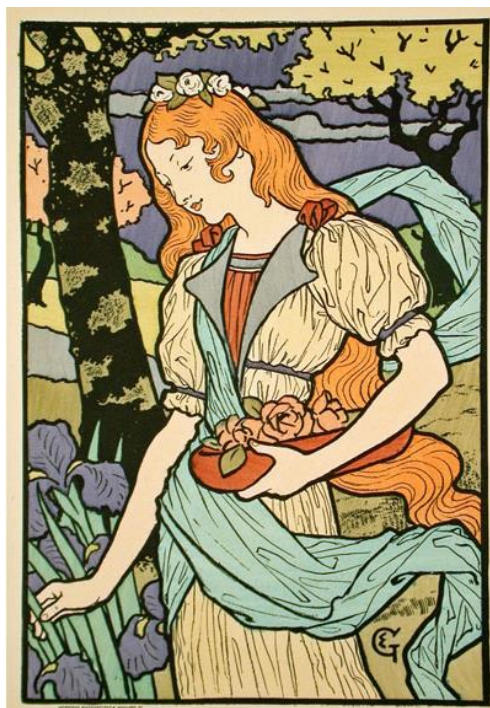
Slika 2. Eugène Samuel Grasset: Poster for an exhibition of French decorative art at the Grafton Galleries, 1893

Spajanjem likovne umjetnosti s umjetničkim i obrtničkim pokretom, Art nouveau stil spojio je ostavštinu simbolizma s novim razumijevanjem i poimanjem slikarske površine. Svijet prirode, cvijeće i uvije prisutna doza mističnog i misterioznog, specifične su značajke ovog umjetničkog pravca koji je otvorio put budućim, suvremenim pravcima kao što je Art deco, zahvaljujući svojoj zaigranosti, sklonosti eksperimentiranju i novim idejama. Upravo zbog toga, Art nouveau portreti prisutni su i danas i raznim oblicima umjetničkog izraza, posebno u primjenjenoj umjetnosti kao što su grafički dizajn, midni dizajn i sl.