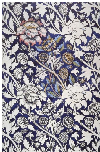
Slika 6. William Morris, dizajn printa na tekstilu, 1883.

Njihova grafička djela koriste nove kromolitografske tehnike kako bi promovirala nove tehnologije, poput telefona i električnih svjetala, pa do određenih prostora poput kafića, restorana, noćnih klubova, pa čak i osoba, pojedinačnih izvođača, itd. 9