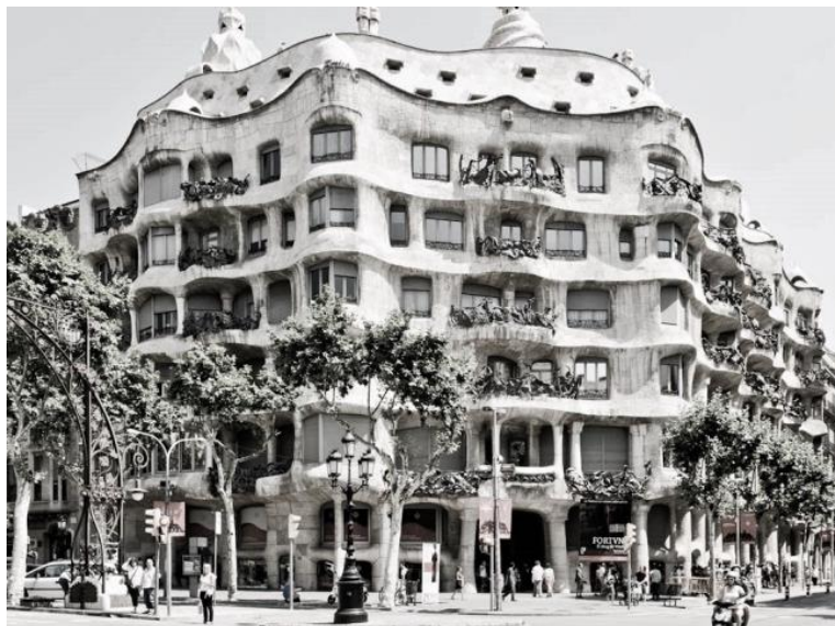
Slika 8. Antonio Gaudi, Casa Mila, 1852.-1926., Španjolska

Najznačajniji primjer stila Art Nouveau u arhitekturi je građevina Casa Mila, Antonija Gaudija, koju, osim navedenog stila, karakterizira i organičko oblikovanje. Kuća se nalazi u Barceloni gdje je nastala u razdoblju od 1852. do 1926. godine. To je zdanje koje je u širokom luku izbjeglo ravne linije, ikakvu simetriju i oštru geometrizaciju, kako bi se stvorio dojam slobodnog oblikovanja krivulja na klesanom kamenu. Vlada nepravilni konkavno-konveksni ritam koji se, osim u interijeru, odlikuje i na fasadi kuće mekanim oblikovanjem te volumenom skulpturalnog karaktera.