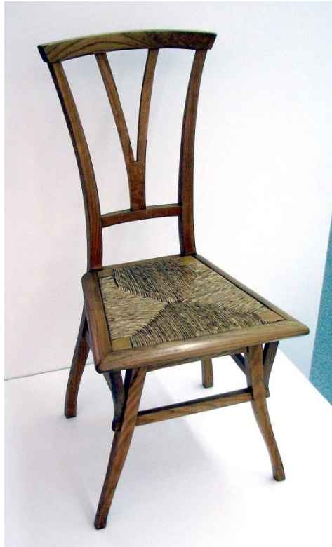
Slika 9. Henry Van de Velde, 1895.

U dizajnu nakita i staklarstvu također je korišten Art Nouveau stil. Emile Gallé, braća Daum, Tiffany i Jacques Gruber su najpoznatiji, barem djelomično, preko svojeg secesijskog stakla i njegove primjene u mnogim utilitarističkim oblicima. Tvrtke Gallé i Daum izgradile su svoj imidž i ugled kroz dizajn vaza i umjetničkog stakla, te pionirskim novim tehnikama pomoću kojih su slojevite površine izgledale kao da prolaze kroz prozirne nijanse. 10 Braća Daum, Tiffany i Jacques Gruber, koji su se obučavali u Nancyu, s Daum postali su stručnjaci za vitraž koji je slavio ljepotu prirodnog svijeta na velikim svjetlosnim pločama.