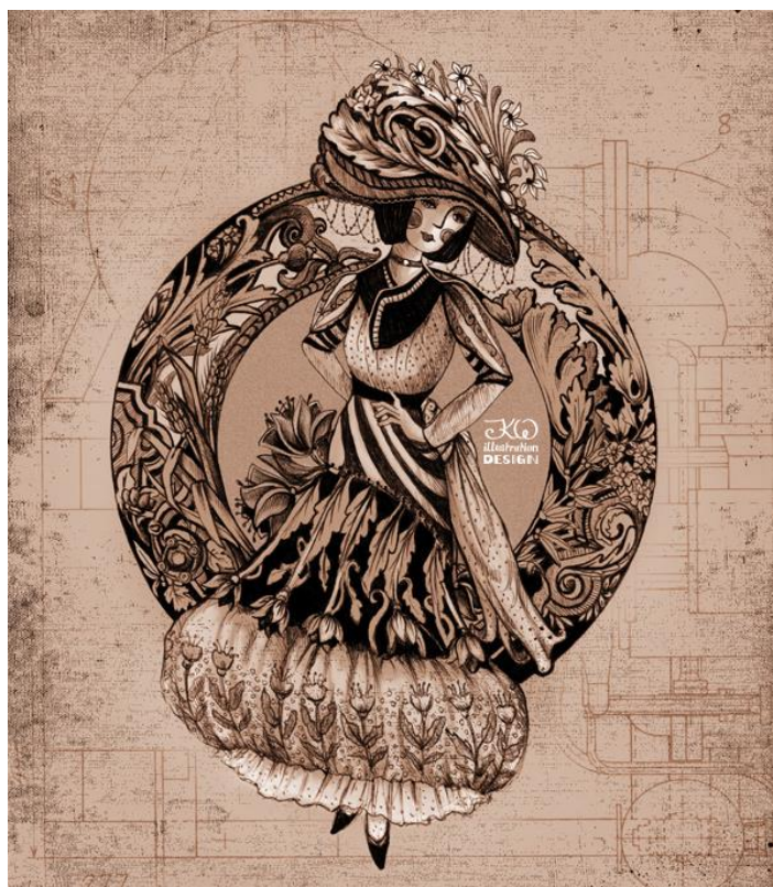
Slika 11. Modna ilustracija u stilu Art Nouveau (n. a.)

Vjerojatno najbolji primjer povezanosti mode i umjetnosti je modna ilustracija, kao vrsta umjetničke forme, odnosno izraza, koja prikazuje idejno rješenje, skicu, modnog dizajnera. Kao takva, modna ilustracija mijenjala se sukladno vremenskom kontekstu kojem je pripadala pa je tako i Art Nouveau utjecao na način prikazivanja i kreiranja modne ilustracije.