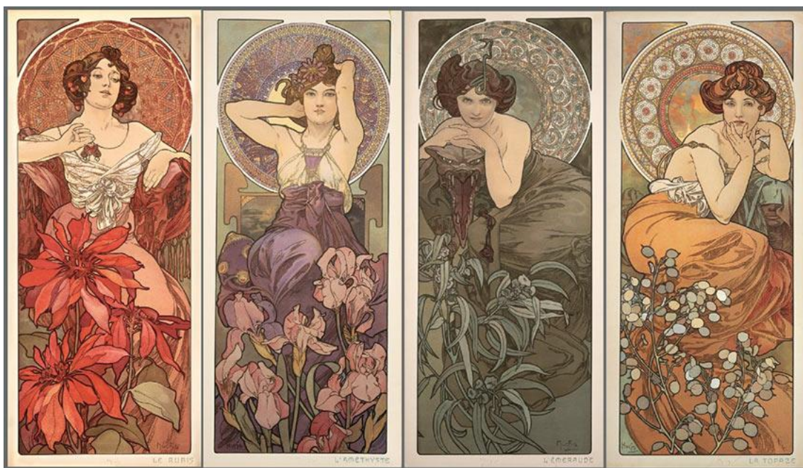
Slika 1. Alphonse Mucha: "The Precious Stone series", 1900.

Portret Art nouveau stila karakterizira bogatstvo iskaza i pristupa, svojevrsno odvajanje od klasičnog pristupa i značajn odmak prema suvremenom, kroz prikaz koji se ne ograničava isključivo na postizanje sličnosti i prikaz osobnosti, već često postavlja i šira pitanja o identitetu osobe, njenom karakteru, njenoj "energiji", uz jako naglašen estetski moment.