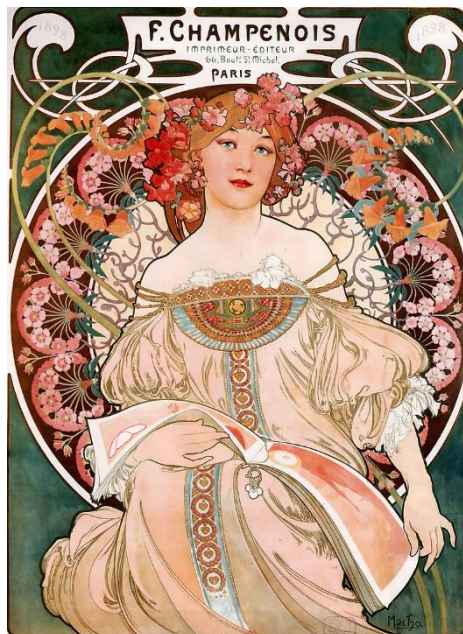
Slika 4. Alfons Mucha: F. Champenois Imprimeur-Éditeur, 1897.

Stručnjaci Art Nouveau tako su nastojali oživjeti kvalitetno majstorstvo, podići mu i proizvesti istinski moderan dizajn koji odražava korisnost predmeta koje stvaraju. Art Nouveau umjetnici pomogli su u sužavanju jaza između finih i primijenjenih umjetnosti.