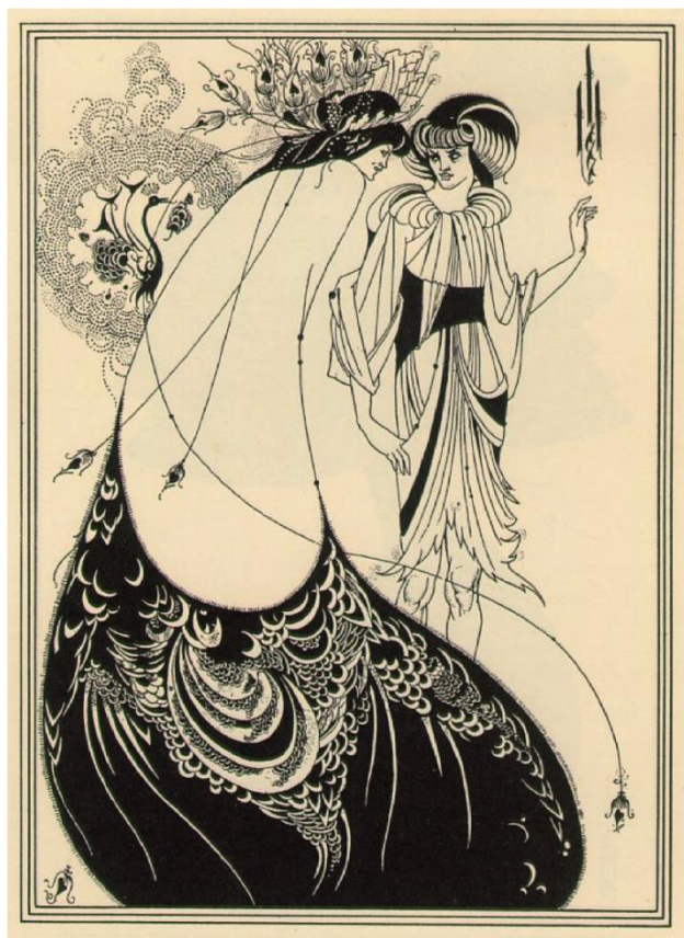
Slika 5. Aubrey Beardsley, "The Peacock Skirt", 1892.

U Francuskoj su najpoznatiji plakati i grafička produkcija Julesa Chéreta, već spomenutog Henrija de Toulouse-Lautreca, Pierrea Bonnarda, Victora Prouvéa, Théophilea Steinlena i još nekolicine autora koji su popularizirali raskošni, dekadentni stil života Belle Epoque (otprilike razdoblje od 1890. do 1914. ).