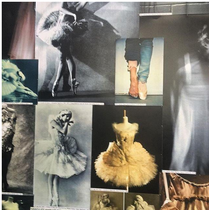
(sl.19) Pozadina baletne scene te isječci koji su inspirirali Valentina za kolekciju jesen/zima 2016.)