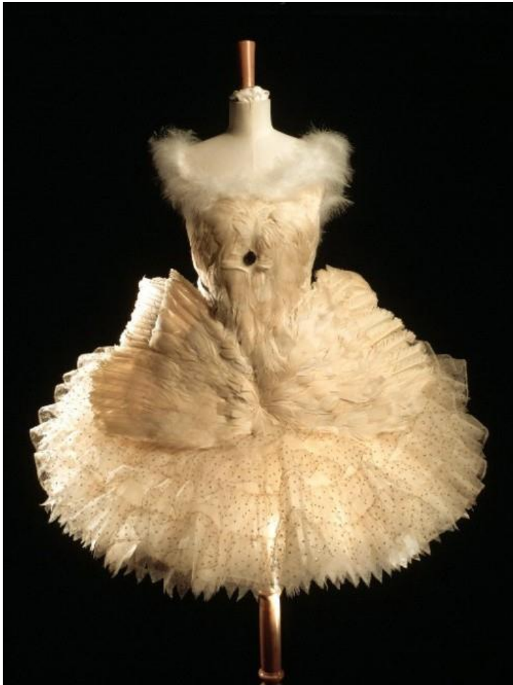
(sl. 16)/ The Swan Lake, baletni kostim, 1907., L. Bakst