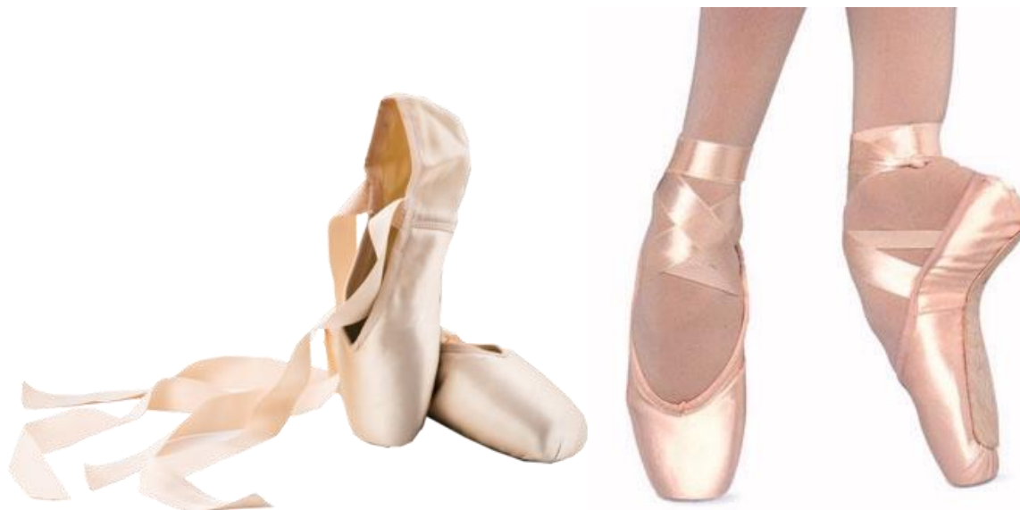
(sl.3) Špicerice danas

Danas poznajemo mnogo proizvodnih oblika špicerica no najjednostavniji primjer vidljiv je u satenskoj podlozi, drvu na vrhovima prstiju koje je pričvršćeno ljepilom za satenski materijal te kožnim dijelom na dnu stopala ukoliko je potrebno.