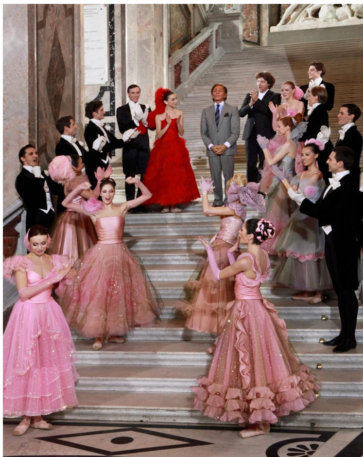
(sl.20) Valentino, 2010.god