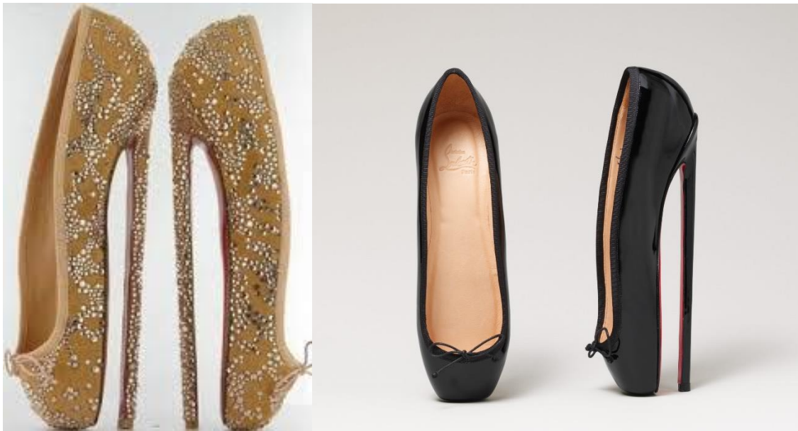
(sl.8/9) „Ballet boot“, primjerak cipele s izraženom potpeticom

Visoke potpetice izraženog vrha nisu obuća u kojoj je moguće hodati ili plesati. To su potpetice korištene u burleskama ili osobnim potrebama, često indicirajući na fetish proizvod. Ideja samog proizvoda je da nogu i stopalo učini što ispruženijom i duljim, potpetica ima minimalnu visinu od 18 centimetara dok predio prstiju ne izgleda nimalo drukčije od klasičnih baletnih špicerica. Po želji, to mogu biti čizme ili niskog kroja salonke, učvršćene gumom ili trakama. Najčešće se proizvode od lakirane, umjetne ili prave kože kako bi bile što čvršće i stabilnije. Nisu pogodne za šetnju te nisu dostupne u trgovinama. Kupnja se najčešće obavlja putem interneta ili osobnog dogovora sa dizajnerom. Prvi poznati primjerak ovakve obuće javlja se ne toliko davno, 1900.godine u Beču kao dio fetish obuće te je potpetica dosegla nevjerojatnih 28 centimetara! Upravo iz tog razloga, što je potpetica bila veća od same cipele – onemogućila je ikakvu mobilnost. Tek krajem XX. stoljeća (1980-tih godina) javljaju se u obliku kakav nam je poznat danas. Na svojoj internet stranici Pierre Silber napominje kako njegovi proizvodi nisu za svakodnevnu uporabu, cipele izrađuje po narudžbi te ih kupci uzimaju za svoje potrebe. Medicinski gledano, ovakav tip obuće ne ide ni malo u korist mušterijama što se tiče pritiska na kralježnicu i stopalo, ne anatomskeg položaja noge te mogućnosti izvrtanja gležnja. Ikakvo dulje nošenje ili korištenje ovakvih potpetica moglo bi ostaviti trajne posljedice.