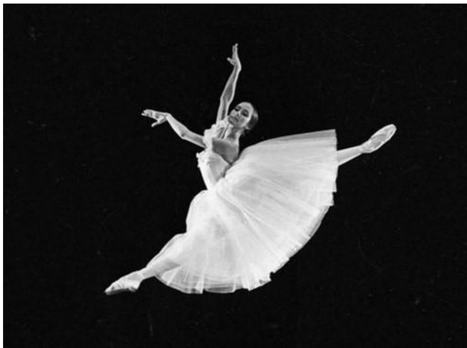
(sl.4) N. Bessmernova, Giselle, 1963.god, dugačka haljina