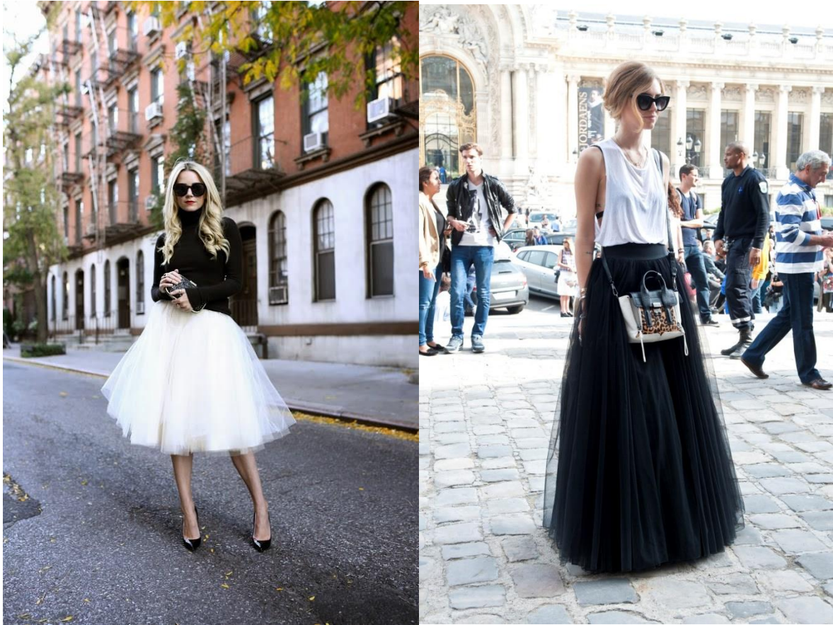
(sl.11/12) Varijacije na klasične baletne haljine u modnom izričaju