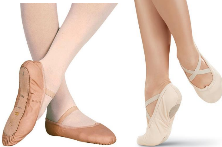
(sl.2) Baletne papučice danas

Izuzev toga što olakšavaju plesačima da se kreću nesmetano po pozornici, pružaju i dodatnu sigurnost time što su učvršćene elastičnom trakom koja naliježe preko samoga gležnja te vrpce koje se reguliraju u otpuštanju i zatezanju same papučice. Dolaze u varijanti jedne elastične trake ili dvije u obliku slova X. Nekada proizvođači samo našiju dvije trake te ostavljaju plesačima da ih sami zašiju kako bi se prilagodile stopalu.