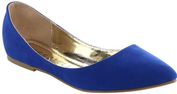
(sl.6) Baletanke s potpeticom

Osim estetičkih značajki, baletanke su predlagane i od strane ortopeda koji savjetuju da su mnogo bolji izbor za stopalo naspram visokih potpetica koje izazivaju bolove u leđima.