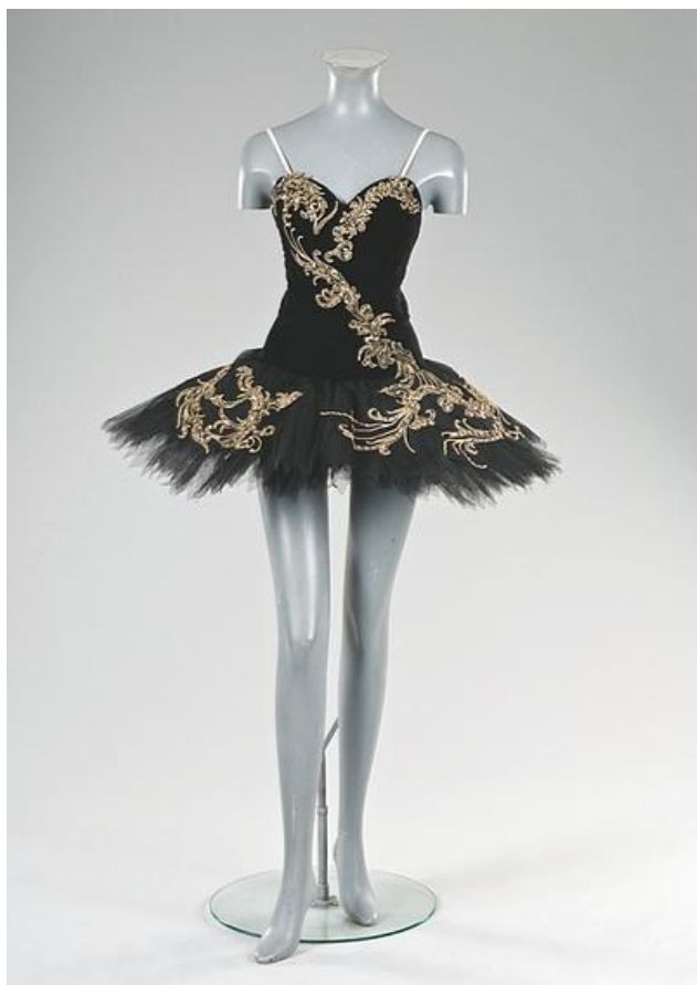
(sl.5) „Pačkica“ , Labuđe jezero