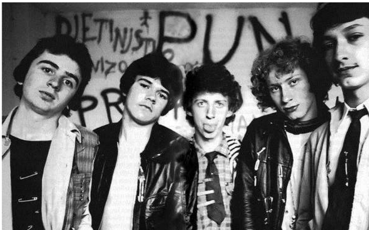
Slika 10.: Prljavo kazalište 1976.

Premda su danas poznati kao rock sastav, Prljavo kazalište isprva svira punk te stilski podsjeća na Sex Pistols. Krajem sedamdesetih u Hrvatsku donose trend "neurednog" , odijevaju raskopčane košulje, kožne hlače te visoke čizme.