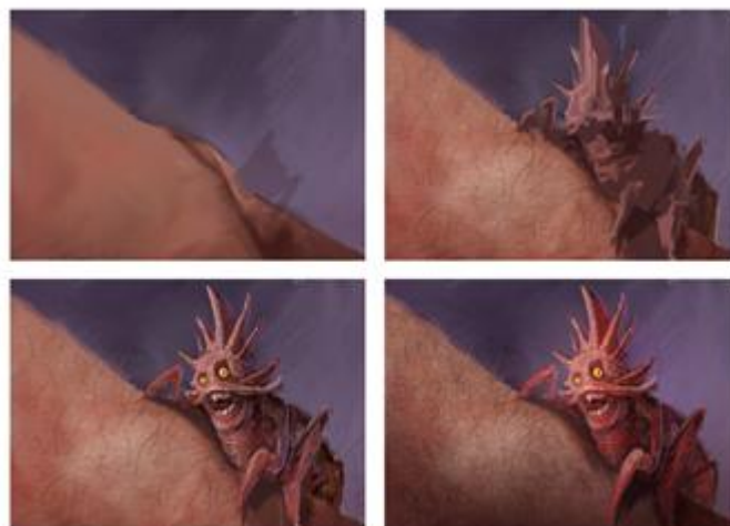
2. Basna „Buha“ -detalj

Prikazana je kako ju taj čovjek vidi u svom pretjerivanju , misleći da mu stvarno treba tuđa pomoć kako bi ju maknuo sa sebe. Ilustracija je odrađena u tehnici digitalnog slikarstva bez intervencije 3D-a, a proces slikanja je klasičan, od velikih cjelina gradio sam prema manjim, do detalja kao što su dlake na koži ruke.