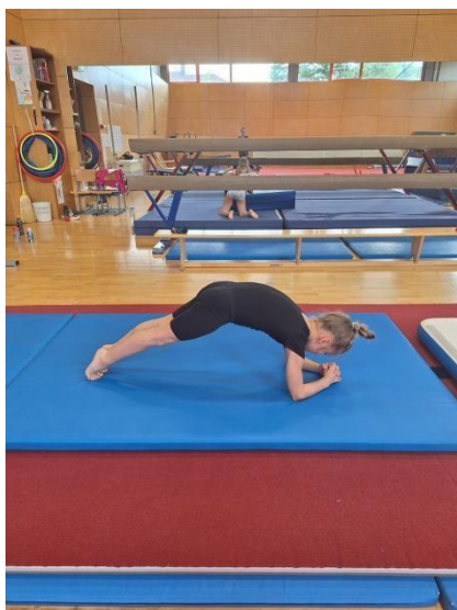
Fotografija 5: Test Plank do otkaza

što duže opruženo. Ovim testom se mjeri izdržljivost mišića cijeloga tijela, a najviše mišića trbuha, ramena i leđa. Rezultat se zapisuje u sekundama.