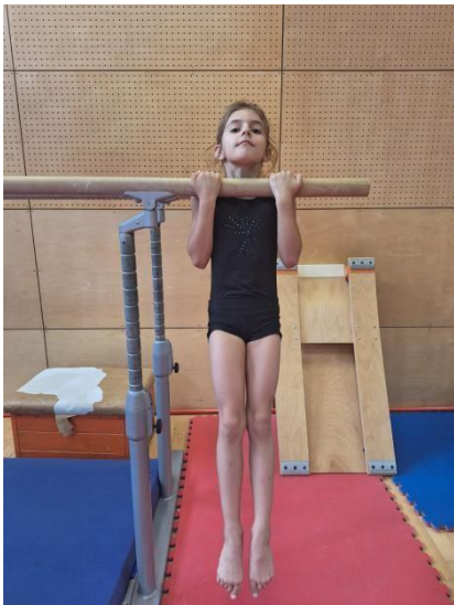
Fotografija 3: Test Izdržaj u visu zgibom

„Test se izvodi tako da se dijete podigne pothvatom dok bradom ne dosegne visinu iznad preče i taj položaj zadržava što je moguće dulje“ (Trajkovski, 2022). Učenik treba izdržati što dulje, tj dok mu se brada ne spusti ispod preče, a ruke se ispruže u laktovima. Rezultat se izražava u sekundama.