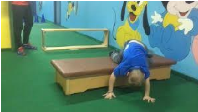
Fotografija 6: Test poligon unatrag