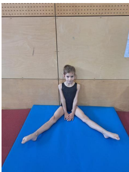
Fotografija 4: Test Pretklon raznožno

„Učenik sunožno sjedne na tlo oslonjen čvrsto leđima i glavnom na zid. Ispružene noge raširi tako da one leže na označenim crtama na podu. U tom položaju ispruži ruke i postavi dlan desne ruke na dlan lijeve ruke, tako da se srednji prsti prekrivaju. Tako postavljene i opružene ruke spušta na tlo ispred sebe. Ramena i glava za to vrijeme moraju ostati oslonjeni na zid. Učitelj postavlja metar s nulom na mjesto gdje učenik dodirne tlo vrhovima prstiju. Zadatak je učenika izvesti što dublji pretklon, ali tako da vrhovi prstiju spojenih ruku lagano, tj. bez trzaja, klize uz metar po podu“ (Pejčić i Trajkovski, 2018). Zadatak se ponavlja tri puta bez, a učitelj zapisuje najbolji rezultat u centimetrima.