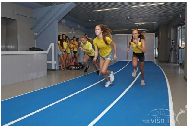
Fotografija 7: Test trčanje 3 minute

„Ovaj test služi za provjeru aerobne izdržljivosti. Start se izvodi iz visokog starta, a važno je da učenik kontinuirano savladava prostor u 3 minute“ (Pejčić i Trajkovski, 2018). Kada se učenik umori od trčanja, smije početi hodati te se i hodanje broji kao krug. Učenici broje koliko su krugova prešli.