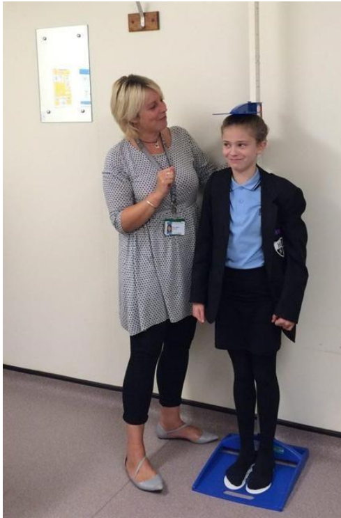
Fotografija 9: Mjerenje tjelesne visine, izvor:

https://www.healthforkids.co.uk/leicestershire/the-nationalchild-measurement-programme/