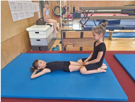
Fotografija 2: Test Podizanje trupa