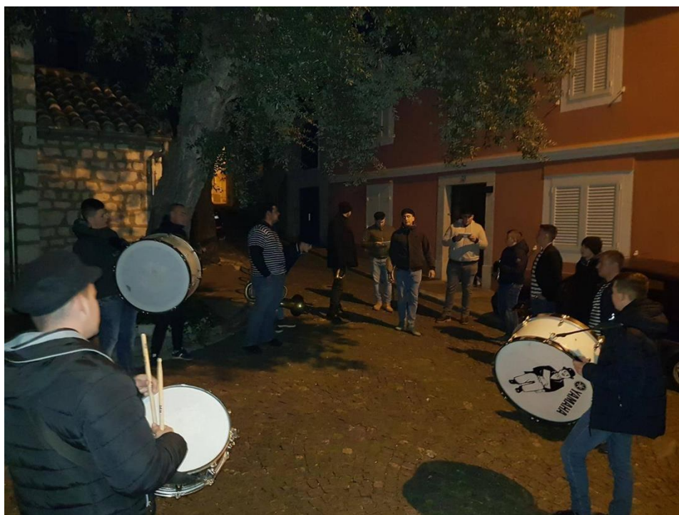
Slika 6. – Prvo napovidanje dovčen i dovican 6

Kada izlaze iz ulice Krasa, kapetani šire paradu i idu do ulaza u ulicu Šćedine te se tada muzika opet ubrzava. Tuče se do prvog raskrižja u Šćedinama, te tada advitor viče POZOR! Mesopustari jako paze da na Placu dođu točno u 22 sata. Od Place se kreće u Šćedine, točnije do prvog raskrižja gdje započinje Prvo napovidanje dovčen i dovican (Blažević, 2012).