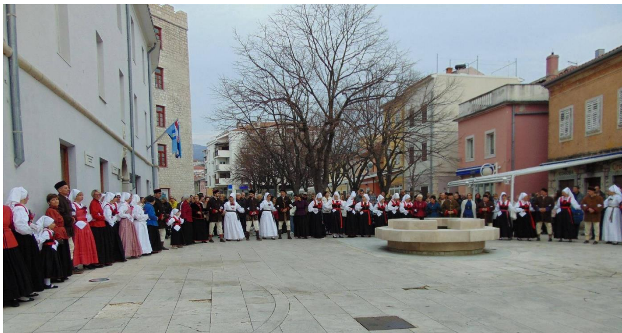
Slika 14. – Igranje novljanskog kola na Placi 14