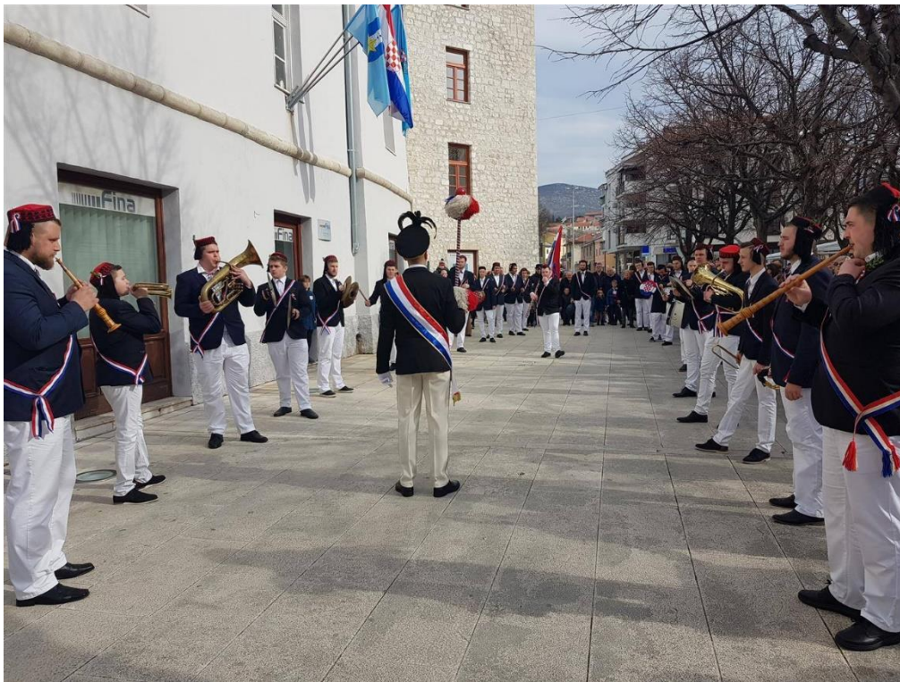
Slika 13. – Mesopustari pozdravljaju Grad Novi Vinodolski 13

Kapetani pozdravljaju institucije Grada, gradonačelnika, predsjednika Gradskog vijeća i sve zaposlene u gradskoj upravi. Nakon što pozdrave Grad, križaju se uz zogu te jedan red mesopustara naizmjenično prolazi kroz drugi red te uz pratnju muzike odlaze do Travice. Kada dođu ispod Travice, mesopustari se okreću prema mesopustu na način da ga gledaju licem (Blažević, 2012).