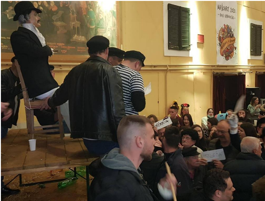
Slika 12. – Odabir imena mesopusta 12