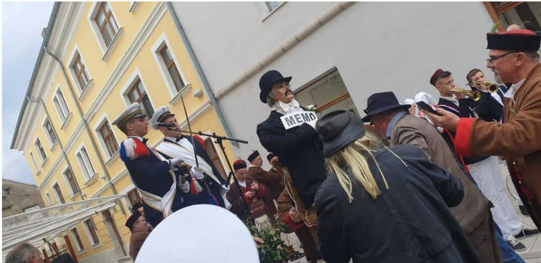
Slika 16. – Sudenje mesopustu 16

Prije svega, prvi auditorov posao je desnom rukom izvaditi, odnosno isukat sablju kako bi mogao pozdraviti. Poslije pozdrava se čita žitak koji je pisan u novljanskom govoru u osmercu,