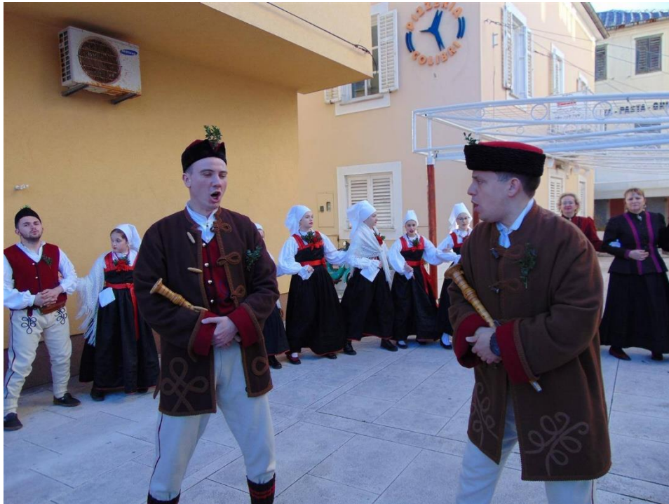
Slika 15. – Pivači novljanskog kola pjevaju dok se igra kolo 15