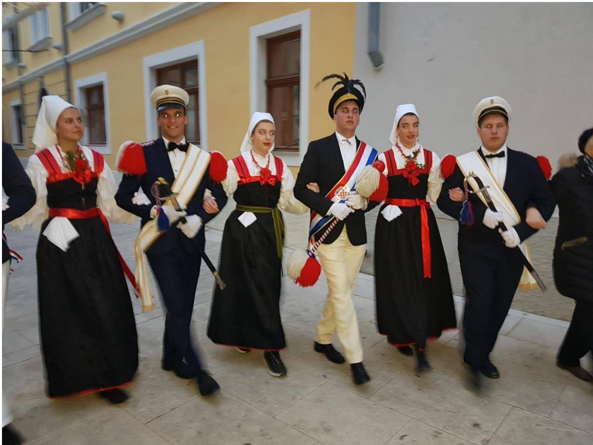
Slika 20. – Novljansko kolo 20

dvodijelna i trodijelna mjera. Korak je trodijelan. Pivač ima pauzu od dva stiha, no iako on ima pauzu, kolo se ne prestaje kretati. Nakon senjskog koraka, započinje arbanaški korak. Arbanaški korak ima jednake korake kao i senjski, ali njihova je razlika u melodiji. Mjera arbanaškog koraka je dvodijelna, a korak trodijelni (Sokolić-Kozarić, 1977). Arbanaškim korakom kolo postaje veselije, življe, brže (Sokolić-Kozarić, 1977). Posljednja je melodija puno življa, a mijenjaju se i koraci. Kolo se kreće na način da se lijevom nogom krene ulijevo, a desna se noga prebacuje preko lijeve. Idući korak započinje na način da se lijevom nogom krene unaprijed, a desnom se korakne unatrag (Sokolić-Kozarić, 1977).