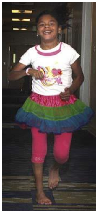
Slika 3. Dijete sa spastičnom hemiplegijom

( https://clinicalgate.com/cerebral-palsy-4/ )