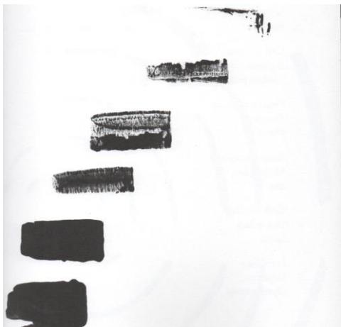
Slika 5. Što sve nestaje