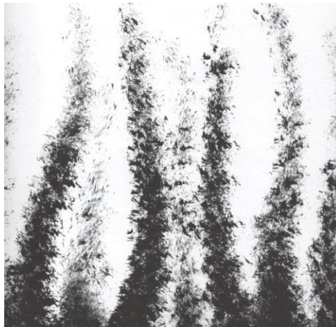
Slika 6. Što sve raste