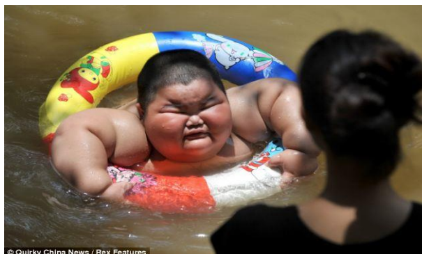
Slika 13 Pretili trogodišnjak pliva

http://www.dailymail.co.uk/news/article-1368790/Lu-Hao-Chinese-toddler-3-weighs-staggering-132lbs-hes-growing.html