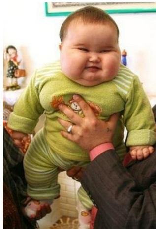
Slika 11 Pretilost šestomjesečne djevojčice izazvana čestim hranjenjem

U dojenačkom razdoblju, edukacija se sastoji od preporuka za dojenje, prepoznavanja prejedanja, zaustaviti hranjenje prije nego što se beba prepuni. Ako siše, ne treba je previše često dojit, npr. svakog sata, bebe koje bi htjele često sisati ne rade to zbog gladi, već zbog ugone ili nesigurnosti. Ako se dojenče hrani adaptiranim mlijekom, bočica ne treba biti spremna u svakom trenutku i ne treba hraniti bebu, kad god zaplače jer plač ne mora značiti da je gladna ili žedna. Poznato je da su prve tri godine razdoblje intelektualnog i psihičkog oblikovanja, to je također razdoblje oblikovanja zdravih navika u prehrani (Bralić, I., 2014.).