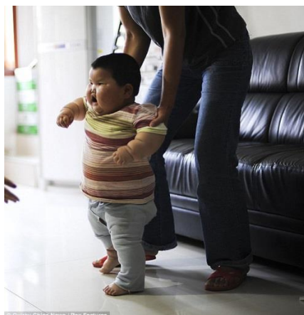
Slika 14 Pretili jedno i pol godišnji dječak u pokušaju hodanja uz podršku majke

U poduzimanju mjera prevencije se treba paziti, da se pretilo dijete ne usmjeri prema potpuno suprotnom smjeru poremećaja prehrane (anoreksija i bulimija). U radu s pretilom djecom i njihovim obiteljima važna je motivacija, empatija stručnjaka te stalna potpora. Iako rješenje problema pretilosti zahtjeva angažiranost stručnjaka različitih specijalnosti, aktivnosti treba usmjeravati prema obitelji u kojoj se stvaraju i oblikuju prehrambene navike i stil života članova obitelji.