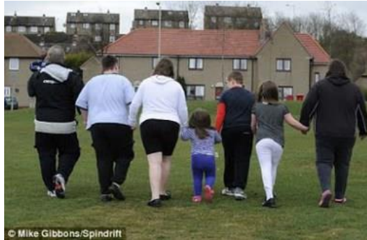
Slika 9 Pretila obitelj

https://theyouthofhealth.wordpress.com/2013/05/12/inside-the-life-of-an-obese-child-2/