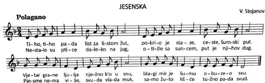
Slika 4: "Jesenska" pjesma (Kraljić, 2017.)