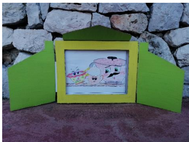
Slika 16. Ilustracija 11. Izvor: Autorica rada, 27.8.2021.