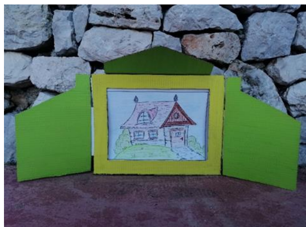
Slika 6. Ilustracija 1.