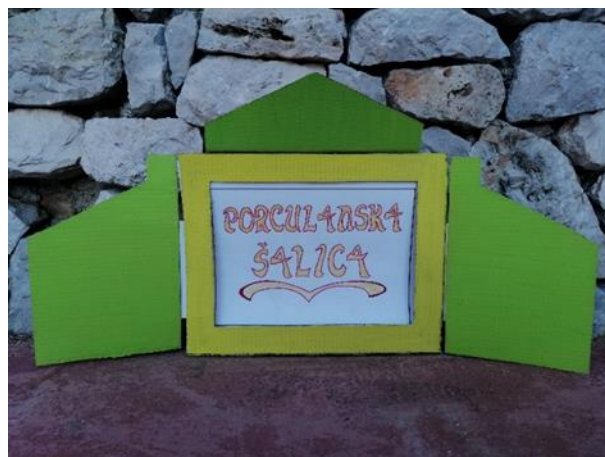
Slika 5. Naslovnica