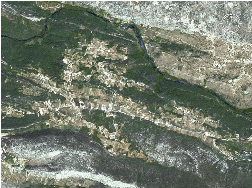
Slika 1. Satelitska snimka sela Kučiče

U ovom završnom radu govorit će se o usmenim narodnim bajkama sela Kučiče. Selo Kučiče malo je mjesto u Dalmatinskoj zagori koje se nalazi na visoravni uz rijeku Cetinu. Prvi se put spominje 1315. godine u darovnici kneza Jurja Šubića. Kučiče je od grada Omiša udaljeno svega petnaestak kilometara te po zadnjem popisu stanovništva broji nešto više od šesto stanovnika. Iako naizgled malo selo, veoma je tradicijski orijentirano te je bogato kulturno-povijesnom materijalnom i nematerijalnom baštinom.