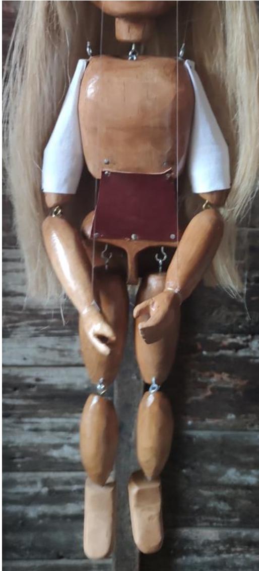
Fotografija 20.