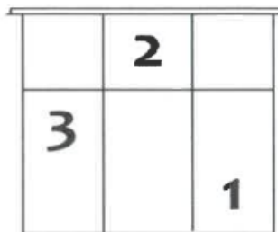
Slika 1. Teren mini odbojke (Hrvatski odbojkaški savez)

Ekipa mora imati najmanje 6 igrača kako bi mogla sudjelovati i igrati utakmicu, a najviše može imati 14 igrača. Na terenu uvijek stoji ekipa od 3 igrača. Svaki od njih stoji u svojoj zoni, zoni 1 (natrag desno), zoni 2 (naprijed na mreži) i zoni 3 (natrag lijevo).